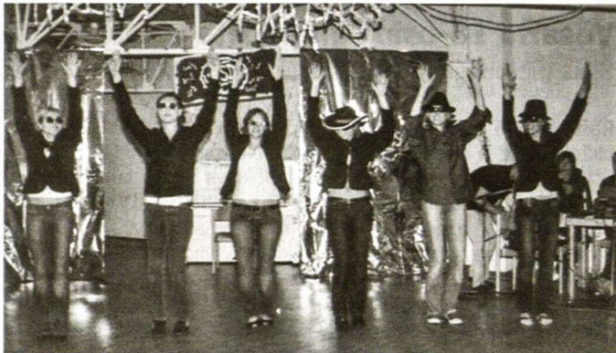
Talentų vakaro rengėjai ateitininkai atlieka programą pertraukos metu tarp pasirodymų