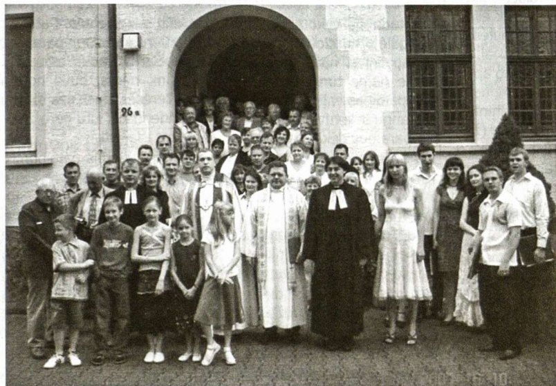
Šventės dalyviai po pamaldų

Paskutinis šios gražios vasaros lietuvių susibūrimas Hagene kaip reta buvo gausus ir šventiškai nuotaikingas. Šio neeilinio susirinkimo hageniečiai susidomėję laukė ir plačiau apie jį diskutavo. Birželio 10-oji bendruomenės narių buvo nekantriai laukiama.