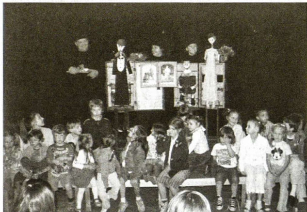
„Lėlės“ teatras Hamburge

šeimos ilgėjimosi tema bus aktuali visada. Be įkyrios didaktikos, be moralų ir pagraudenimų tėvų ir vaikų (ne)susikalbėjimo motyvas įgijo spektaklyje subtilią ir menišką raišką. Puiūs aktoriai, gražūs jų balsai, nuotaikinga muzika ir nuostabios lėlės padovanojo mums be galo prasmingą ir jaudinantį reginį.