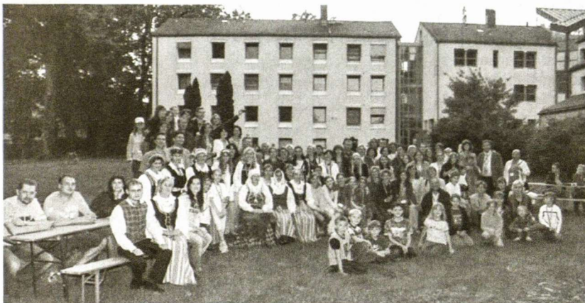
Prie laužo susėdę linksmi dainavo