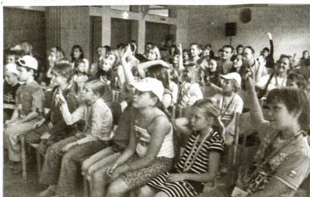
Spektaklis atidžiai sekamas