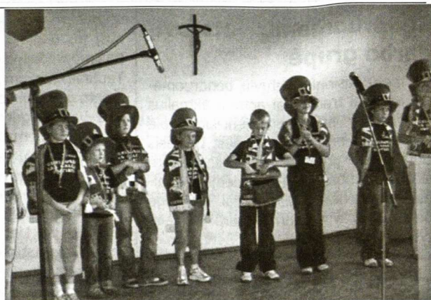
Pristato Dublino lituanistinė mokykla „4 vėjai“