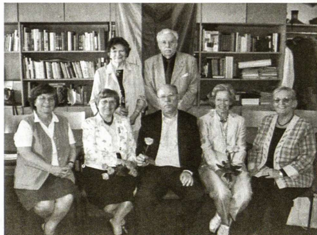
Dalis minėjimo dalyvių (iš k. į d.)