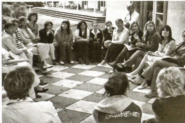
Mokytojoms salėje diskutuoti buvo per karšta