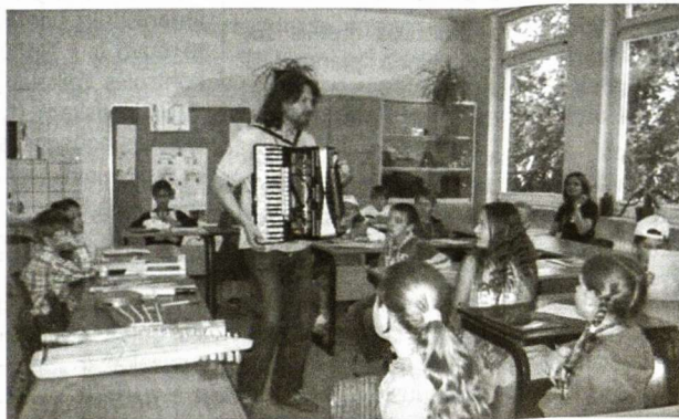
Su muzika lengviau mokytis