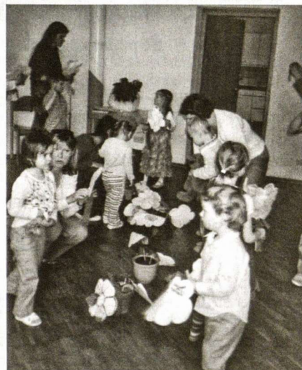
Kiškiukai įteikia mamytėms gėlytes

Mažiau emigrantų. Per pirmuosius (2004 m.) narystės Europos Sąjungoje metus emigrantų iš Lietuvos skaičius išaugo 1,4 karto – nuo 22,7 tūkst. iki 32,5 tūkst. Daugiausia – 48,1 tūkst. – emigravo 2005 m. Per 2006 m. emigrantų skaičius sumažėjo: emigravo apie 27,8 tūkst., tai beveik du kartus mažiau nei 2005 m. ir tik penktadaliu daugiau nei 2003 m. (Stat. dep.)