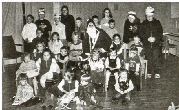
Kalėdų senelis aplanko kiškių klubą