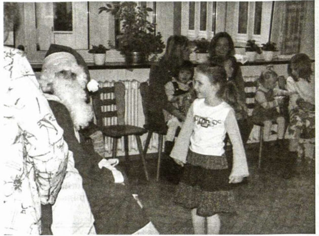
Kalėdinis susitikimas Stuttgarte

L. Klafs, Kapellenweg 61, 70378 Stuttgart, tel. 0711-532835