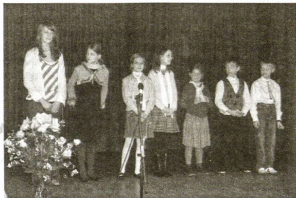
Hamburgo mokyklėlės vaikučių pasirodymas

Kiekvienas mes turime „savo“ Vasario 16-ąją, kartais – kelias. Kitos Vasario 16-osios arba visai ištirpusios, susiliejusios su šimtu ir tūkstančių dienų kasdienybe arba įstrigusios atmintin tik viena kita detale, išblukusiu, tarsi nepriklausomybės laikų trispalvė, vaizdu, gal dienoraščio sakiniu, gal „Smetonos laikų“ mokyklinio vadovėlio lapu. Lietuvoje švenčiamos trys šalies valstybingumą žyminčios šventės – Vasario 16-oji, Kovo 11-oji ir Liepos 6-oji. Kaip galėtume palyginti šias tris šventes, jų vietą mūsų istorinėje savimonėje? Kuri šventė mums yra pati svarbiausia? Kalbant apie Vasario 16-ąją ir Kovo 11-ąją, tenka naudoti „pirminės“ ir „antrinės šventės“ sąvokas. Kovo 11-oji yra antrinis Vasario 16-osios aidas. Vasario 16-oji lietuvių tautos sąmonėje ne tik žymi patį Valstybės atkūrimo aktą, bet ir turi ilgą šventimo okupacijos metais istoriją. Emociškai išgyventas trispalvės šmėstelėjimas vasario 16-ąją okupuotoje Lietuvoje gliaui įsirėžė į daugelio mūsų atmintį.