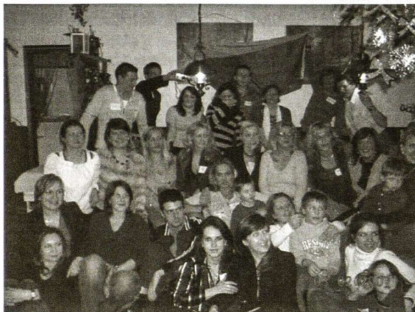
Kugelio balaus dalyviai