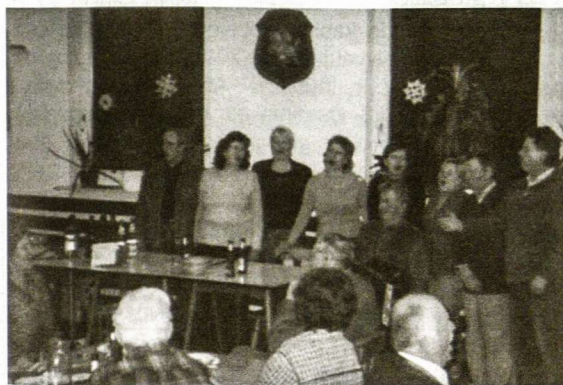
Po spektaklio gimnazijos salėje kupiškėnai dar linksmai dainavo