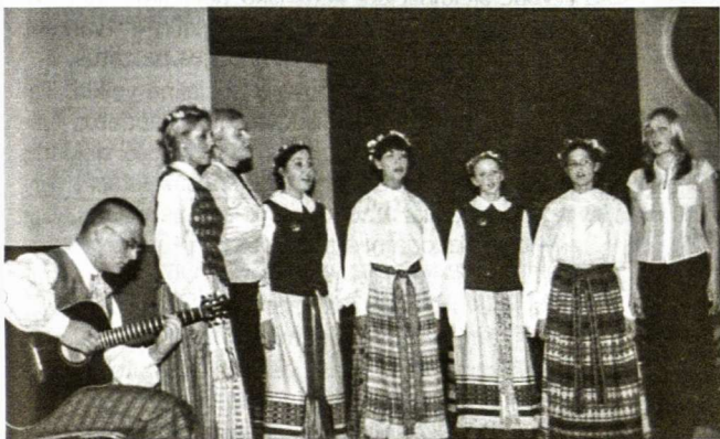
Mokinių ansamblis Vasario 16-osios minėjime Hüttenfelde (Nuotrauka M. Šmitienės)