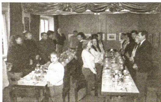
Akimirka iš Vasario 16-osios minėjimo

Organizuojant susitikimus stengiamasi, kad kuo dažniau jie būtų teminiai. Štai š.m. sausio mėnesio susitikimo metu buvo rengiamas fašingas su karaoke. Pritariant visiems vakaro dalyviams, buvo dainuojamos populiaros