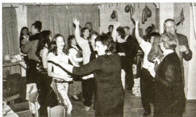
Gruodžio 31 d. valdyba surengė Naujųjų metų sutikimą Vasario 16-osios gimnazijos bendrabučio salėje. Atvyko veik 40 svečių. Buvo sakomi įvairiausi tostai, žaidžiami įdomūs žaidimai, o šokiai ir dainavimas tęsėsi iki ryto.