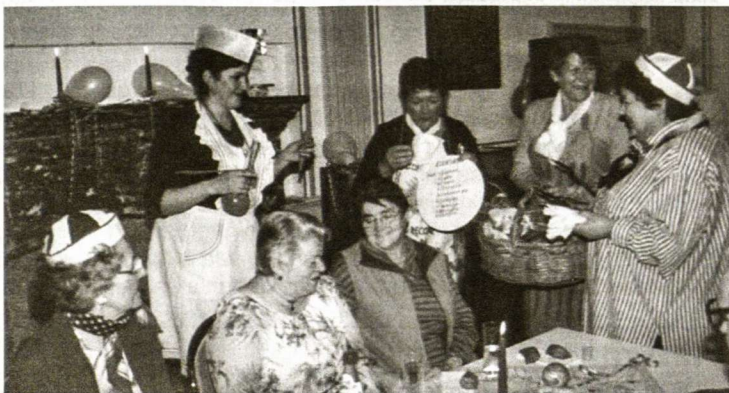
Romuvos LB apylinkės Užgavėnių puota