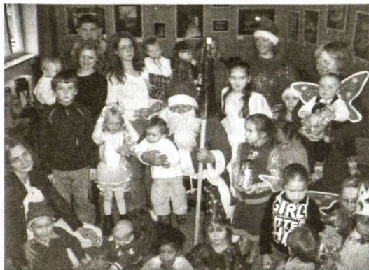
Kalėdų senelio apsilankymas

įvairių Lietuvos scenos atlikėjų dainos. Vakaras baigėsi linksmais bendrais šokiais. Vasario 16-ajai paminėti skirtame susitikime diskusijose buvo apžvelgtas Lietuvos kelias į nepriklausomybę ir paprastų žmonių indėlis bei vidiniai jų išgyvenimai, susiję su šiuo procesu. Tą pačią tematiką atspindėjo ir ta proga A. Hermanno suorganizuota meninių nuotraukų paroda bei atlikti keli muzikiniai kūriniai.