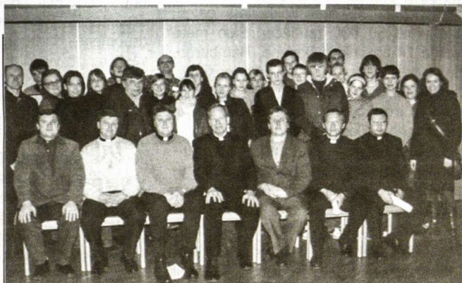
Lietuviai kunigai su ateitininkais, mokiniais ir mokytojais gimnazijoje