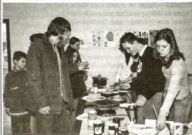
Gimnazijos atvirų durų dienos kavinėje

Po to svečiai apžiūrėjo gimnazijos patalpas, stebėjo chemijos kabinete atliekamus eksperimentus, kuriuos demonstravo mokytoja L. Manß, žiūrėjo R. Buechsensteino ir H. Herbelio sukurtus filmus apie gimnazijos gyvenimą, kasmet organizuojamus slidinėjimo kursus Italijos kalnuose. Buvo apžiūrėta ir mokytojos