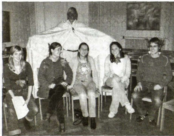
Vyno rūsio vaiduoklis

Š.m. paskutinį spalio mėnesio savaitgalį, Vėlinių išvakarėse, Annabergo namuose, Bonnoje, vyko Baltijos šalių jaunimo suvažiavimas. Pagrindinė suvažiavimo tema buvo „Vakarų kultūros įtaka Baltijos šalims“, atsiemianti į Helloweeno šventę. Jos metu Annabergo namai tapo vėlinių, raganų ir kitų pabaisų puotos vieta. Pagrindiniai renginio organizatoriai buvo Vokietijos lietuvių jaunimo sąjunga kartu su keliais Latvijos šalies atstovais.