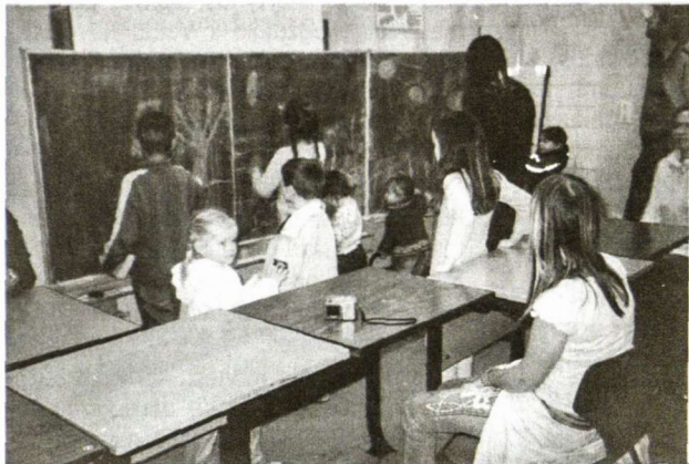
Kiškučiai ir kiškytės mokosi tikrojo mokykloje

Ant tų pačių čiuzinių sugulę klausosi lietuviškų pasakų, kurias „teta“ jiems paskaito. Kai orai būna palankūs, organizuojamos ekskursijos į Romuvos parką pas kiškių liepą ir į tvenkinio salą. Taip pat einama į