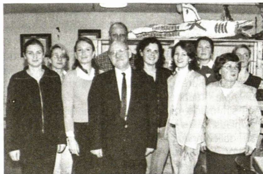
Hamburgo apylinkės vadovai ir dalyviai