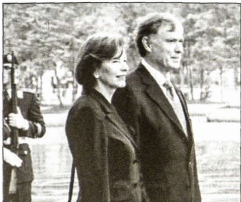
Vokietijos prezidentas H.Köhleris su žmona Eva Luise