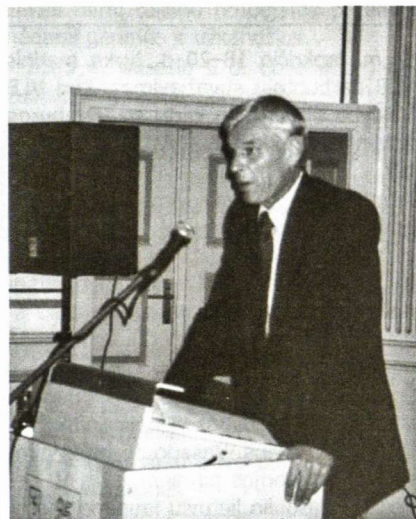
Justas V. Paleckis

Buvęs ambasadorius ir užsienio reikalų viceministras, dabar Europos Parlamento narys Justas Vincas Paleckis pažvelgė į Lietuvos perspektyvas Europos Sąjungoje iš lietuviško taško. Jis trumpai apžvelgė sunkumus stojant į Europos struktūras ir nurodė, kad Baltijos valstybių balso Briuselyje kol kas mažai paisoma. Lietuva taip pat netapo Rusijos eksperte, į kurios siūlymus būtų atsižvelgiama, kaip kad buvo tikėtasi. Apskritai politika Rusijos atžvilgiu formuluojama greičiau Berlyne ir Paryžiuje negu Briuselyje, nes Rusija yra strateginis partneris ir energijos tiekėjas. Lietuviai laikosi 3 dėsnių: 1) nenorima revoliucinės kaitos ES; 2) žmonės apsisprendė už tokią ES, kokia ji yra, todėl nenorima reformų ES ir 3) nenorima bet kokių valstybių susigrupavimų ES. Pranešėjas manė, jog ūkio atžvilgiu lietuviai greitai mokosi, todėl atsižvelgiant