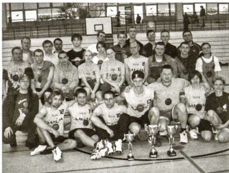
Krepšinio turnyro finalistai Žalčiai iš Heidelbergo–Mannheimo su Punsco komanda

Po alinančios dienos, atkaklių kovų, dar atkaklesnių ir aistringų diskusijų aikštelėje, tačiau puikiai nusiteikę Europos lietuviai krepšininkai ir sirgaliai grįžo į Vasario 16-osios gimnaziją. Čia jau vakarienės metu skambėjo lietuviškos dainos. Šventė tęsėsi Romuvos pilaitės salėje: liejosi gėrimai, o dainos ir šokiai tęsėsi iki ryto. Intensyvus pasirėngimas bei didelės organizatorių pastangos atsipirko su kaupu: smagus bendravimas pranoko iš visos Europos suvažiavusių tautiečių lūkesčius ir visiems paliko neišdildomą įspūdį.