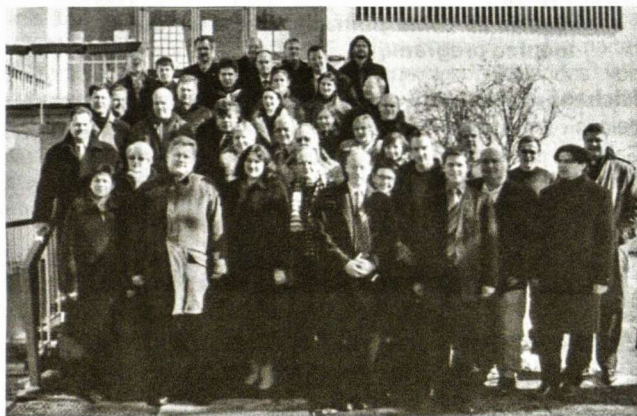
Pasitarimo dalyviai

Padėtis nėra visur vienoda. Problemų yra įvairių. Naujieji lietuviai ateiviai dar neidentifikuoja savęs kaip išėiviai (pvz., Airijoje). Bet ir Beneliukso šalyse, kur vien Europos struktūrose jau dirba keli šimtai asmenų, neįjuntama poreikio burtis į bendruomenę, nors žmonės stengiasi palaikyti ryšius su tautiečiais.