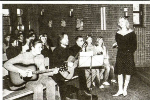
Gimnazijos mokiniai mini pelenų dieną

vietose, jau gali sužinoti tik iš vyresniųjų pasakojimų, spaudos ar televizijos laidų. Tuo tarpu mūsų gimnazijoje tos įsimintinos šūrprios nakties įvykius, nusinešusios žmonių gyvybes vaizdus, mokiniai galėjo stebėti mokykloje įrengtame fotonuotraukų stende, apie tai buvo pasakojama per pamokas, visą dieną rodomas dokumentinis filmas. Sausio 13-osios aukoms pagerbti tą dieną gimnazijoje buvo iki pusės stiebo nuleista Lietuvos valstybės vėliava.