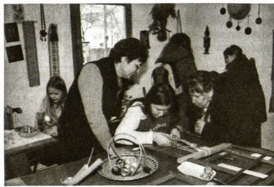
Atvirų durų diena