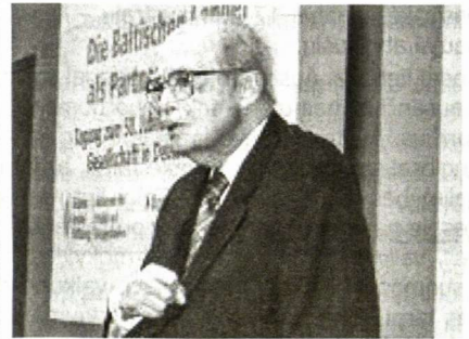
Dr. Otto von Habsburg