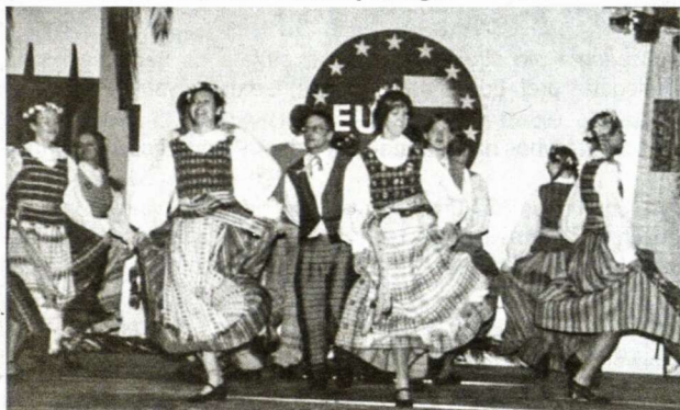
Vasario 16-osios gimnazijos mokiniai atlieka meninę programą