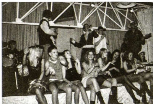
Gimnazijos mokinių karnavalas