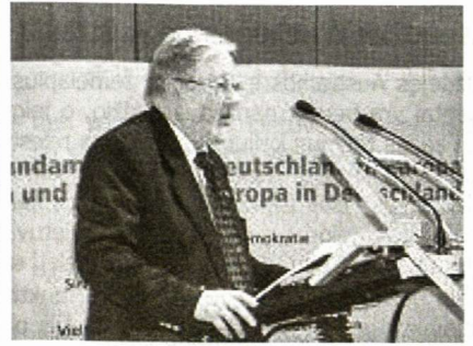
Prof. Vytautas Landsbergis