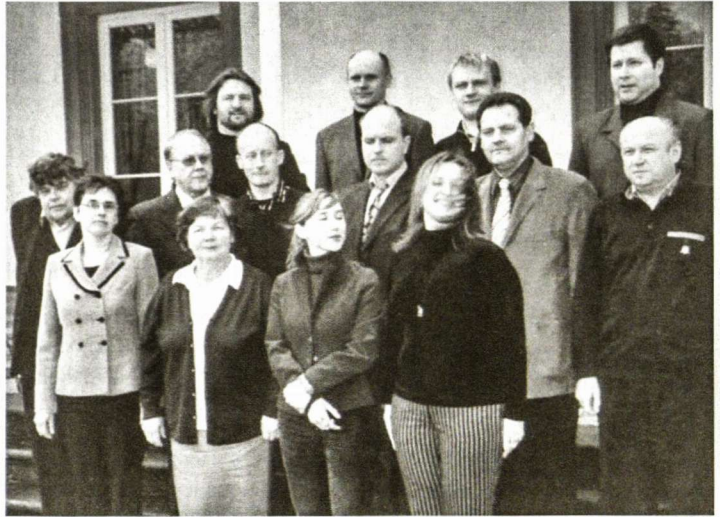
VLB Taryba 2005–2008 m.

Po Kontrolės komisijos pranešimo, kurį padarė V. Lemke, Taryba patvirtino 2004 m. apyskaitą ir 2005 m. sąmatą ir atleido valdybą nuo pinigines atsakomybės už 2004 metus.