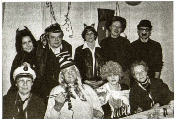
Romuvos LB apylinkė švenčia užgavėnias