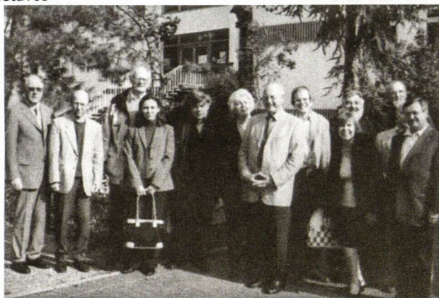
LKI suvažiavimo dalyvių dalis

spaudos. Tai buvusi sena krikščioniška, kartu europietiška savimonė, kuri nepažūstama nepriėmė ir sėkmingai atmetė svetimos civilizacijos kėslus. Tai buvusi bene didžiausia Lietuvos dovana Europos civilizacijai. Šioji laimėjo subjektą, kuris ir didžiausioje priespaudoje bei pažemintas neišdavė jos vertybių.