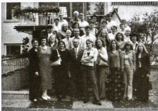
Seminaro dalyviai