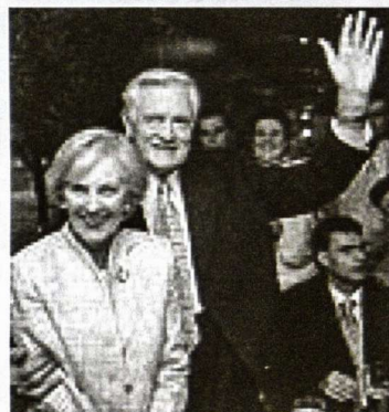
LR Prezidentas Valdas Adamkus ir Alma Adamkienė

Mano kartos išeivijai lietuviybės išsaugojimas buvo savaime suprantama būtinybė. Mes buvome politiniai pabėgėliai, priversti palikti tėvynę, nes grėšė susidorojimas, fizinis sunaikinimas. Į tremtį vykome, širdyse sergėdami laisvos Lietuvos idėją. Ne tik lietuvių kalbos, kultūros, tradicijų išsaugojimas, bet ir politinės pastangos nuolat priminti pasauliui okupuotos tėvynės bylą mums buvo vienas svarbiausių gyvenimo tikslų.