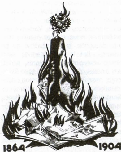
1864-1904 m. lietuvių spaudos draudimo simbolika

Kaip tik tuo metu Rusijos imperijos valdžia griebėsi lietuvių rusifikacijos politikos, kuri buvo nukreipta prieš lietuvių kalbą ir lietuvišką knygą. 1864 m. buvo uždarytos nevaldiškos, tarp jų ir vysk. Motiejaus Valančiaus įsteigtos lietuviškai mokiusios parapajinės pradžios mokyklos, uždrausta privačiai mokytis namuose. To negana, Rusijos valdžia 1864–1865 m. uždraudė leisti pradžioje tik elementorius, o paskui ir visus lietuviškus leidinius lietuviškais – lotyniškais, o paskui ir gotiškais – raidėmis. Kartu įsakė visus leidinius spausdinti tik