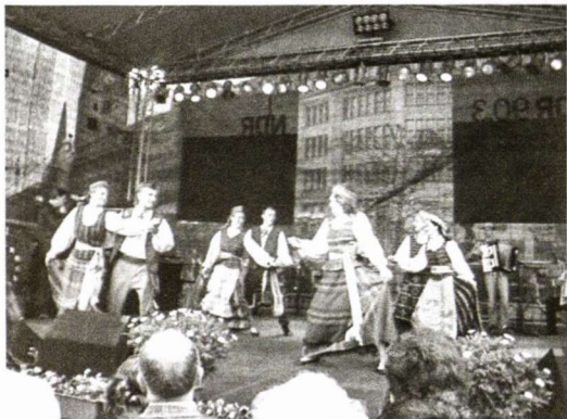
Šoka Rotušės aikštėje

jau praėjo visas pusmetis nuo paskutinės repetacijos, kai Tu mus mokei naujų šokių žingsnelių, tad labai Tavęs pasiilgom. Kad tu žinotum, kiek mes turėjom paprakaituoti, kol gerai išmokome naujus šokius: "Blezinginį Jonkelį", "Vakaruškas"! Šokiai yra tikrai smagūs ir žaismingi, tačiau buvo sunku surasti aštuntąjį šokėją! Jo taip ir nesuradom, tiesiog pasitenkinom dar viena šokėja. Lietuvoje tokios problemos tikriausiai nebūtų, nes didelis šokėjų pasirinkimas, o čia žmonės labai dažnai keičiasi ir jau dabar žinau, kad rudenį mūsų kolektyvą teks suburti iš naujo, o gaila – kiek smagių ir "prakaituotų" akimirų praleidome kartu repetuodami ir pasirodydami! Keitėsi ne tik mūsų