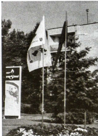
PLB vėliava Birštone

Birštono vardas pirmą kartą paminėtas 1382 m. kryžiuočių kronikose kaip "sodyba prie sūraus vandens" (Birstain). XIV a. stovėjo medinė pilis, kuri nė karto priešio nebuvo užimta, vėliau ji tapo karališkuoju dvaru. Miškuose dažnai medžiodavo Lietuvos valdovai. XIII a. Birštono apylinkėse buvo suformuotas valsčius, o 1518 m. Birštonas jau vadinamas miestu. XIX a. miestas pradėjo garsėti gydomųjų savybių turinčiais mineraliniais vandenimis. 1846 m. – kurorto įkūrimo metai. 1966 m. Birštonui suteiktos respublikos pavaldumo miesto teisės. Birštonas yra jaukus, tvarkingas, ramus kurortas. Jis išsidėstęs pietinėje Lietuvos dalyje, Nemuno kilpų regioniniame parke. Lankytojus labiausiai traukia savo stebėtina gamtovaizdžio harmonija, sveika aplinka, švelniu klimatu ir mineraliniais vandenimis.