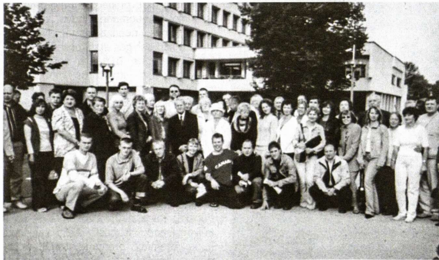
Suvažiavimo dalyviai prieš išvykstant į Birštoną