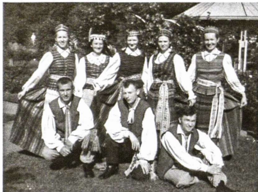
Hamburgo tautinių šokių grupė