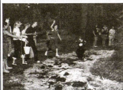
Naujokų krikštynos

Nelengvu išbandymu gimnazijos naujokams tapo antrasis rugsėjo savaitgalis. Penktadienio vakarą tryliktokai „nuoširdžiai“ pasistengė, kad naujieji gimnazistai ne tik visiems susirinkusiems pademonstruotų, bet ir patys įsitikintų savo išstvermingumu ir dideliu noru tapti gimnazistais. Išstvermės trasą, kurią turėjo įveikti naujokai, buvo pilna netikėtumų. Norėdami šią trasą perbėgti, būsimieji gimnazistai turėjo patirti ne tik šalto vandens dušą ant galvos, bet ir