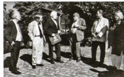
Vokiečių politikai svečiuojasi gimnazijoje