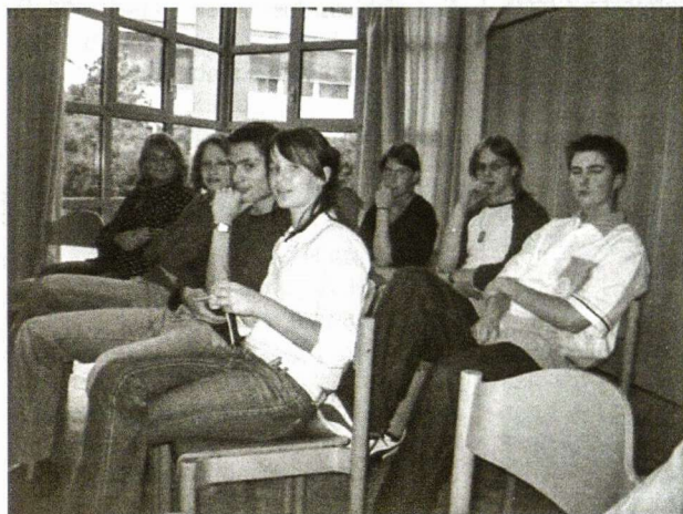
Suvažiavimo dalyviai klausosi paskaitos