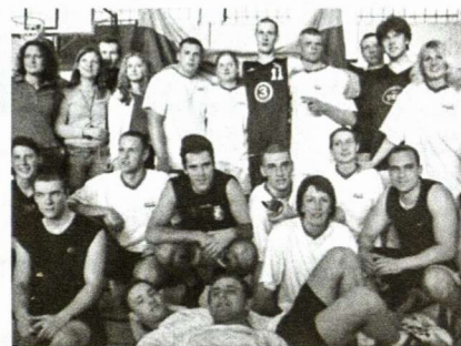
Mišri Hüttenfeldo/Kopenhagos komanda