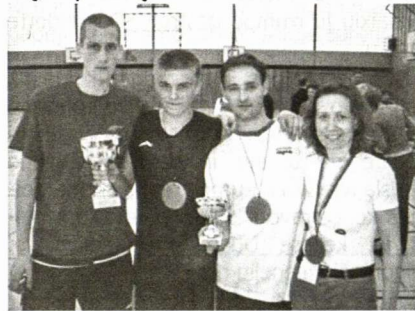
Komandų kapitonai su organizatore