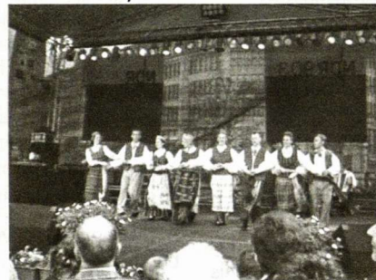
Hamburgo tautinių šokių grupė šoka Europos dienoje

Dainiaus Vidžiūno burtų keliu sudaryto varžybų grafiko dėka turnyras neužsitęsė. Kaip ir numatėme, po 10 valandų įnirtingų kovų po krepšiais, atsipūtimo valandėlių ir "cheer leaders" pasirodymų, buvo apdovanoti nugalėtojai, įteikti prisiminimo medaliai bei diplomai, garbės taurės – auksą iškovojusiai Vasario 16-osios gimnazijos gimnazistų komandai iš Hüttenfeldo (Vokietija), sidabrą – Kopenhagos sportininkams (Danija), o bronzą atiteko sportininkams iš Punsko (Lenkija), žinoma, nepamiršome įteikti paguodos prizų ir mažiausiai taškų surinkusiai Berlyno komandai.