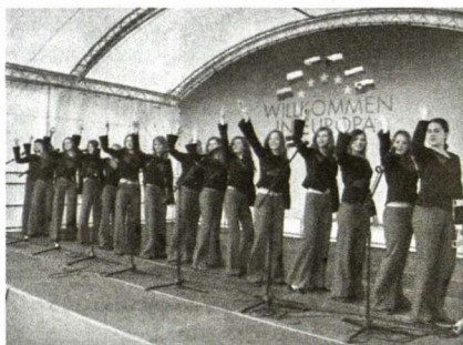
Gargždų muzikos mokyklos dainų studijos „Svirplys“ kolektyvas