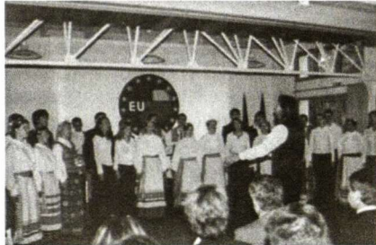
Gimnazijos mokiniai atlieka programą

Hüttenfelde gyvenantys lietuviai jau iš vakaro susirinko pilies kieme ir lygiai 24 val. Lietuvos laiku bokšte iškėlė ES, Vokietijos ir Lietuvos vėliavas. Nuskambėjo Europos, Vokietijos ir Lietuvos himnai. Kuklus, bet įspūdingas fejerverkas skelbė miestelio gyventojams lietuvių džiaugsmą.