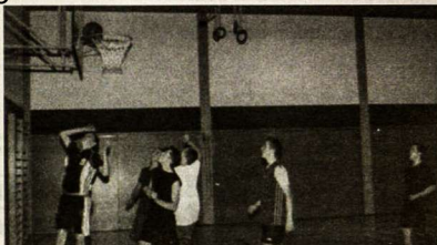
Vasario 16-osios gimnazijos mokiniai krepšinio turnyre