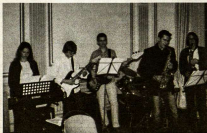
Vokietijos susivienijimo šventės išvakarėse svečiams groja Vasario 16-osios gimnazijos orkestras