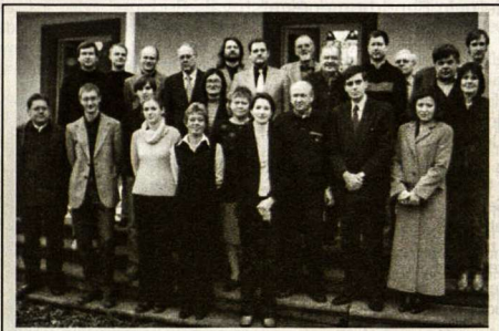
Darbuotojų suvažiavimo dalyviai

Š.m. lapkričio 14–16 d. Romuvoje įvyko tradicinis Vokietijos LB darbuotojų suvažiavimas. Dalyvavo Vokietijos LB valdybos, tarybos bei kitų organų nariai, Romuvos, Frankfurto, Stutgarto, Bonn-Köln, Müncheno, Hageno, Mülheimo ir Hamburgo apylinkių, Vasario 16-osios gimnazijos, Lietuvių kultūros instituto, Katalikų sielovados, PLJ Kongreso ruošos komiteto, Pasaulio lietuvių jaunimo sąjungos valdybos ir Vokietijos LJ sąjungos valdybos atstovai. Iš Lietuvos dalyvavo