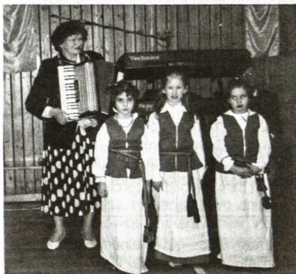
Dainuoja jauniausios minėjimo programos dalyvės.

koj didelę šeimą (juokiasi). Trūko lietuviškų patiekalų ir gėrimų. Kur cepelinai, vėdarai, kugelis? Lietuviško alaus jau irgi galima Vokietijoje nusipirkti. Dar pasigedau programoje vaikų. Jų, čia gimusių ir jau paūgėjusių, tikrai nemažai, bet pasirodo vis tos pačios mergaitės.