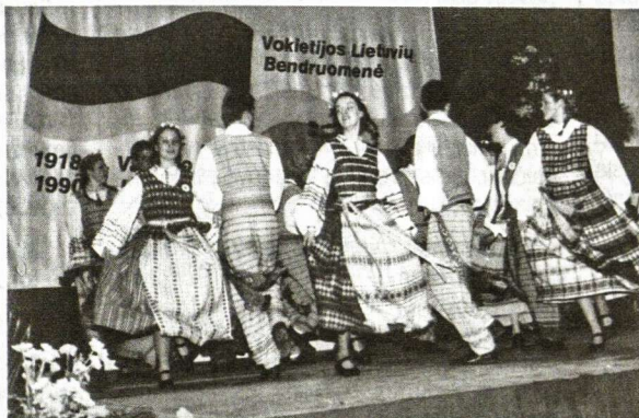
Nuotraukose: gimnazistų programos akimirkos.

Jei matuosime, kaip vertinami lietuviai ir specialiai Vokietijos lietuvių bendruomenė Vokietijos visuomenėje pagal į Lietuvos Nepriklausomybės dienos minėjimus susirenkančių aukštų svečių skaičių, tai galime pasidžiaugti, esamu aukštu lygiu. Nors šie metai ir nebuvo taip gausūs tokiais svečiais, kaip pernykščiai, kai buvo minimas ir Vasario 16-osios gimnazijos jubilėjus, tačiau jiems skirtos kėdžių eilės Bürgerhaus salėje neliko tuščios.