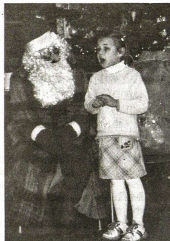
Kalėdų senio tikrumu vaikai nesuabejojo.