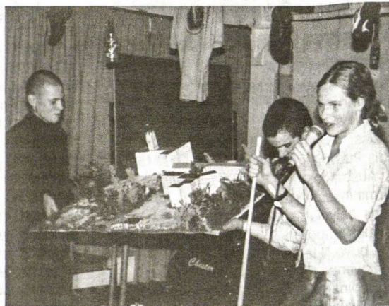
Devintokai pristato savo sukurtą gimnazijos parko projektą.