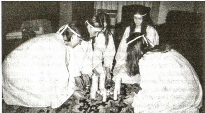
Vaidilutės iš Hamburgo prie tradicijų aukuro.

Kartu iškylavome laivu Reino upe, susikibę už rankų dainavome „Tegyvuoja Baltija“. Daug šiltos, prasmingos kamerinės