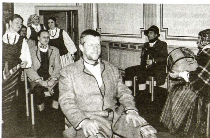
"Insulos" ansambličiai taip smagiai dainavo, šoko ir liaudies žaidimus rodė, kad ir žiūrovus iš savo vietų išjudino.