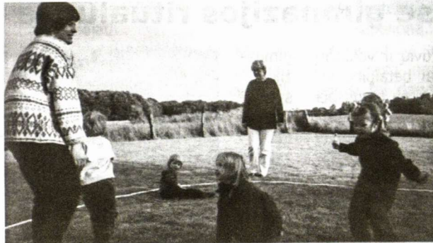
D. Baliulytės nuotraukose: viršuje - estafetės dalyviai traukia virvę, apačioje - mūsų mažieji šventės metu.