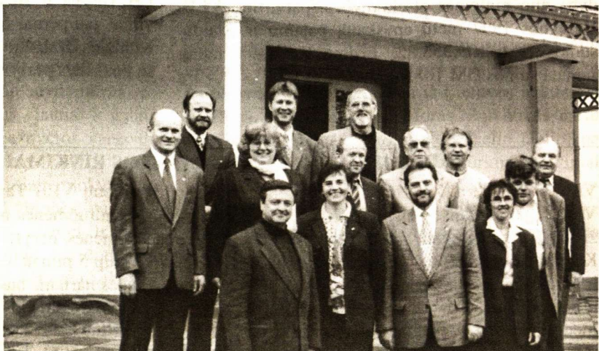
Vokietijos LB Tarybos nariai