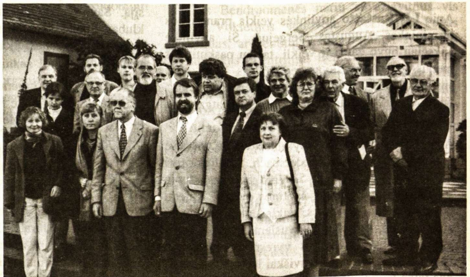
Vokietijos LB darbuotojų suvažiavimo dalyviai prie pilies

Įprasta centrinių Bendruomenės organų veikla atsispindi Informacijose, todėl čia nekartojama. Ateityje gali atsirasti tam tikrų sunkumų, jeigu Vokietijos vidaus reikalų ministerija sustabdys savo iki šiol teiktą paramą. Tokiu atveju veiklą finansuoti teks vien iš nario mokesčių. Todėl bus kreipiamasi į nebeveikiančių apylinkių narius, kurie jau perrašyti į centrinę apylinkę, kad šie taip pat susimokėtų solidarumo įnašą ir tuo prisidėtų prie tolimesnės lietuviškos veiklos Vokietijoje užtikrinimo.