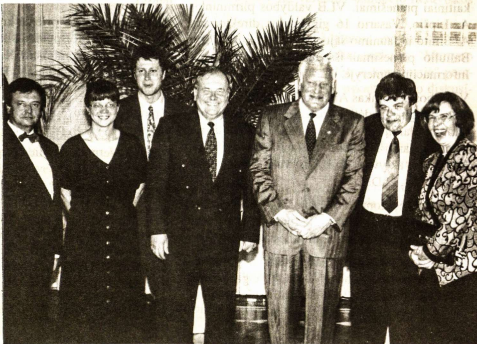
Lietuvos Respublikos Prezidentas A. Brazauskas ir Vokietijos LB atstovai IX PLB Seimo uždarymo vakaro proga