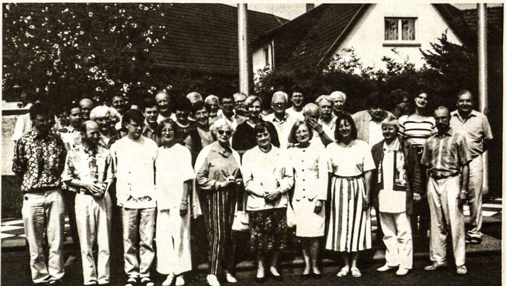
44 ELSS dalyviai