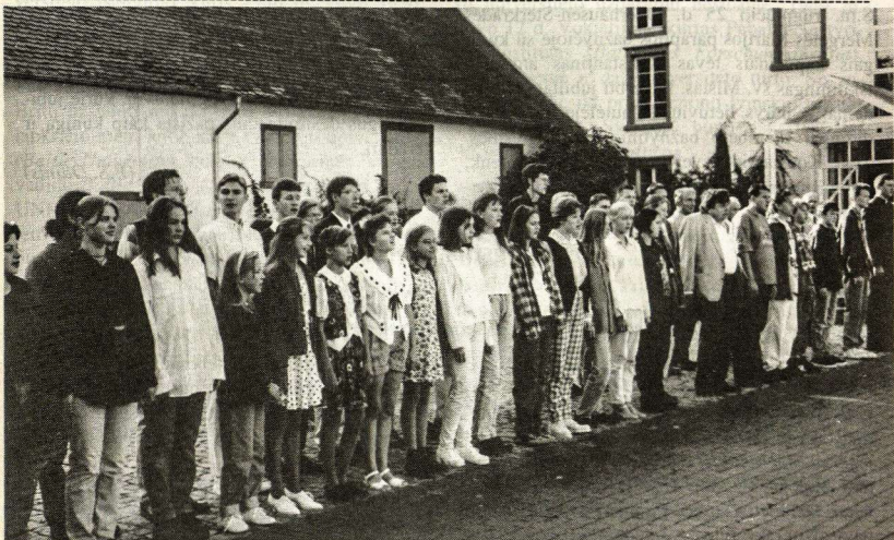
Vasario 16 gimnazijos mokytojai ir mokiniai vėliavos pakėlimo metu