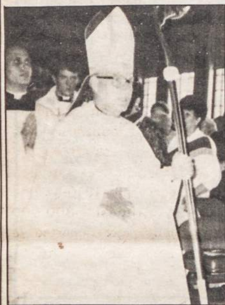
Bishop James T. McHugh

The weather was perfect! No uncomfortable heat or humidity. Just a clear and bright sunshiny day.