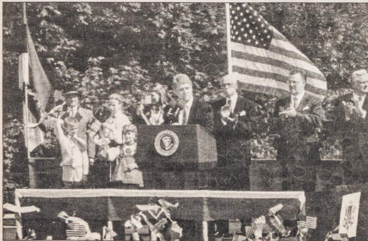
JAV prezidentas Bill Clinton liepos 6 d. Rygoje kalba prie Laisvės paminklo.

Apie 5 val. JAV prezidentas Bill Clinton išskrido į Lenkijos sostinę.