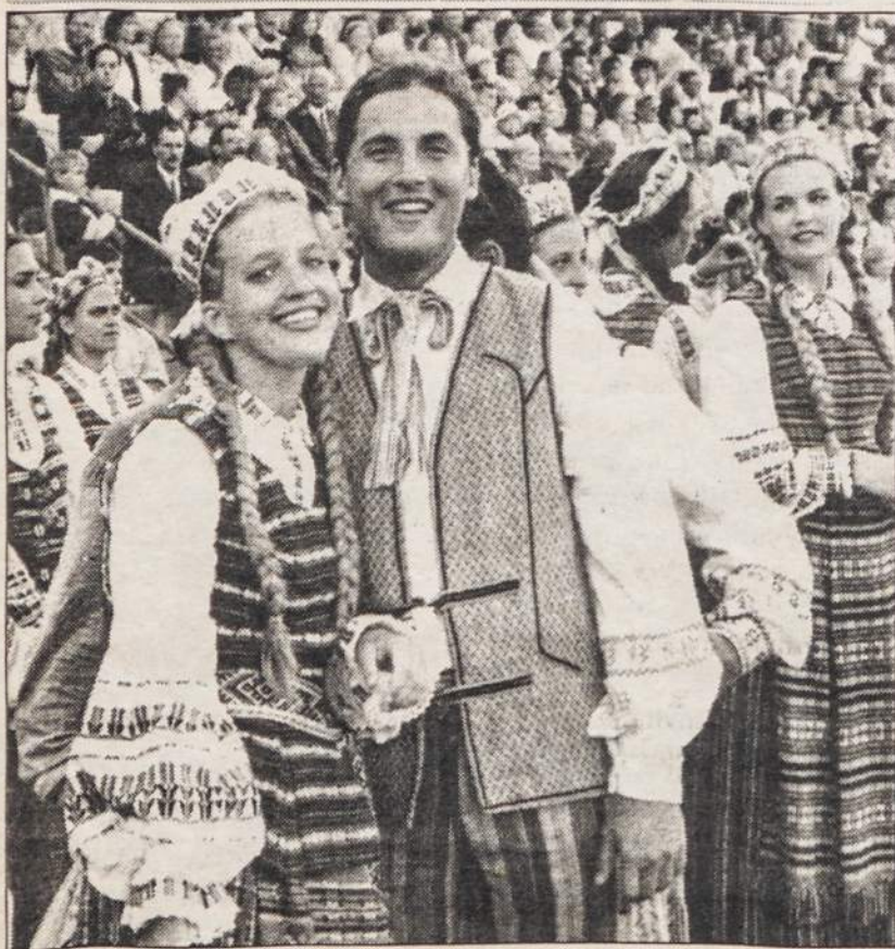
Šokėjai iš Chicagos Dainų ir Šokių šventėje Vilniuje.

-- Paminėtas "Sietyno" draugijos , 1894 m. įsikūrusios Už-