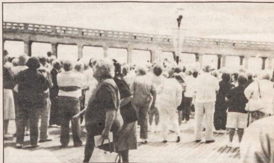
The statue is barely visible in the center of the picture. The sea gulls that had been flying all over the place suddenly took positions between the overhead columns standing still as if saluting the Mother of God.

While the Bishop, followed by the clergy and representatives of various organizations, and the thousands of pilgrims walked out to the ocean, one by one the pilgrims removed their shoes and walked in the water. Some had bottles and filled them with the blessed water from the Wedding of the Sea.