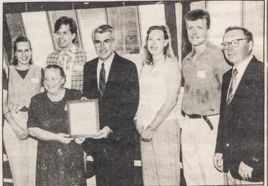
Governor Jim Edgar held a reception in honor of the Lithuanian Dance Groups from the state of Illinois performing in Lithuania at the Song Festival. The reception was held at his Chicago office where the Governor presented the Grandis group with an official congratulatory letter.