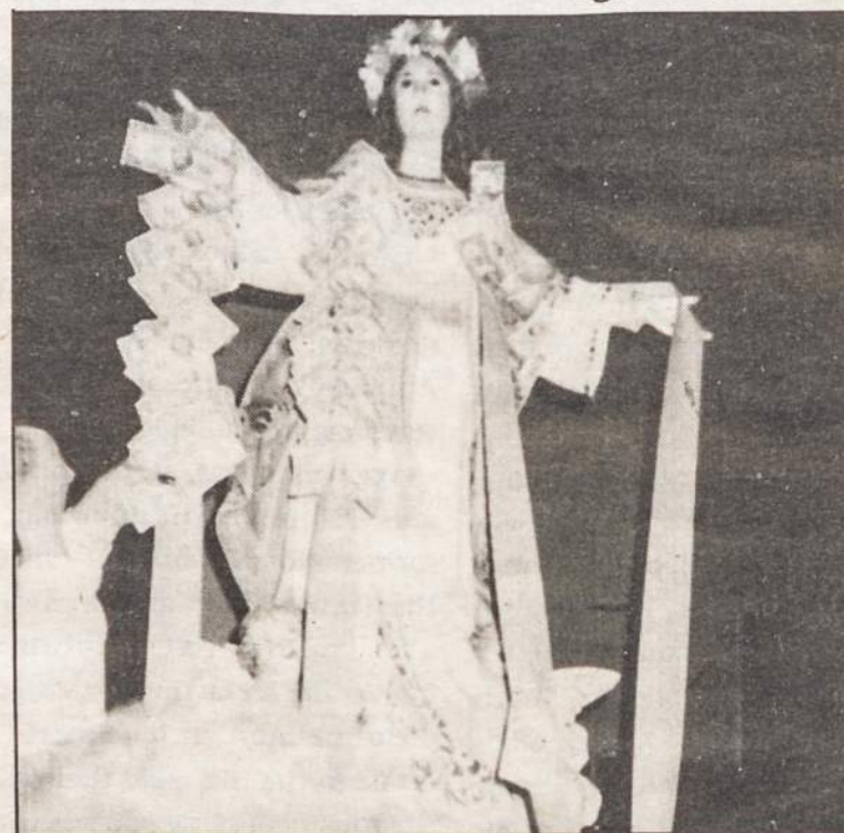
The statue of the Assumption at the beginning of the celebration when the committee women began pinning dollar bills on the ribbons. After a short while, the statue was over-run with bills. This is an old Italian custom.

While the Bishop, followed by the clergy and representatives of various organizations, and the thousands of pilgrims walked out to the ocean, one by one the pilgrims removed their shoes and walked in the water. Some had bottles and filled them with the blessed water from the Wedding of the Sea.