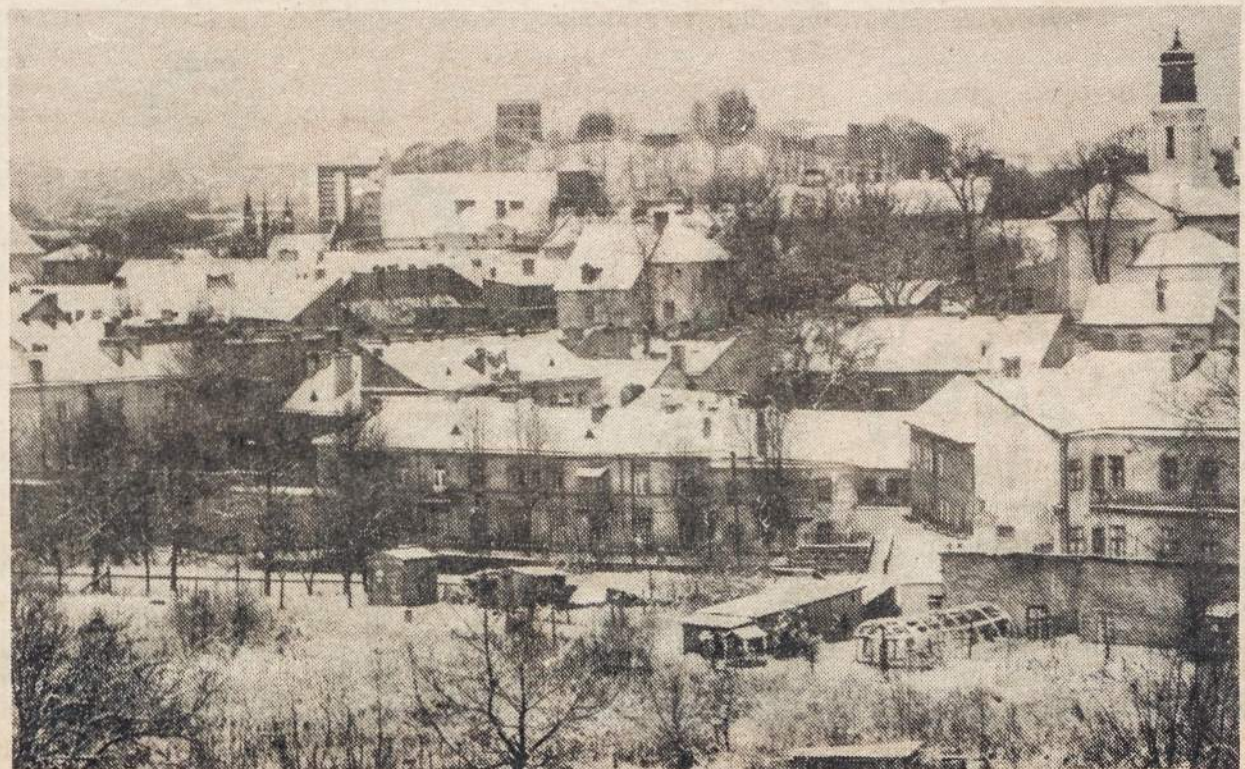
Vilniaus senamiestis po pirmuoju sniegu.

firmos pramogų centras. Jame bus rengiamos populiaros, anksčiau per valstybinę TV transliuotos laidos: "Pusė per pusę", "Videokaukas", "Taip ir ne", įvairios muzikinės programos. Pagal bendradarbiavimo sutartį, pasirašytą pusei metų su Tele-3, kiekvieną penktadienį penkias valandas Lietuvos žiūrovai matys programines "LITPOLIINTER" televizijos laidas.