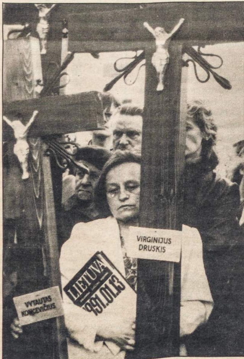
Sausio 13-osios aukos kasmet prisimenamos prie Lietuvos TV bokšto.

"...Lietuva iškelia ir išaukština savo gynėjus, dar sykį patvirtindama, kad nemirtingumą ir amžiną šlovę suteikia tikrai Tėvynė" (iš J. Marcinkevičiaus kalbos 1991 m. sausio 16 d.).