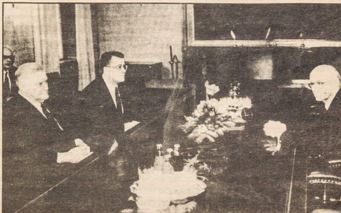
Baltic leaders outline areas of agreement

When the three Baltic Presidents met in Tallin on December 15 - 16 for the inaugural opening of the Baltic Institute for Strategic and International Studies, they also discussed several issues of concern to the republics of Estonia, Latvia and Lithuania.