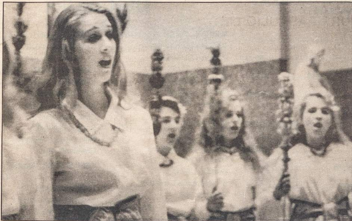
"Pastoralė", Kauno mergaičių sakralinės muzikos choras, atlikęs apie 30 koncertų JAV ir Kanadoje (taip pat ir New Yorke), grįžo į Kauną. Vytauto Maželio nuotraukoje — tuometinio koncerto metu.