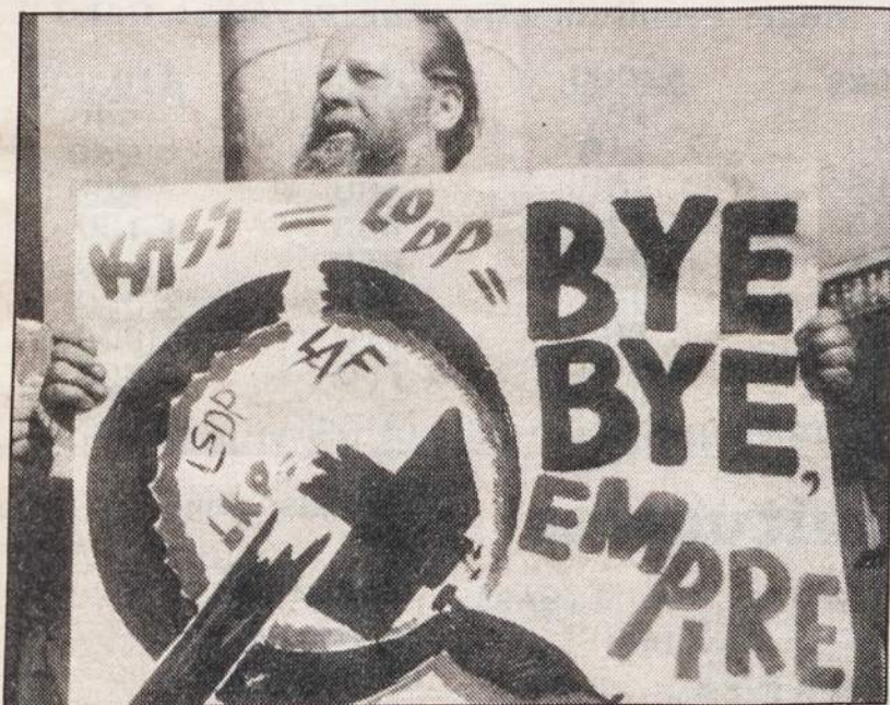
Sovietų Sąjungai žlugus, Lietuvoje nuotaikos išreiškiamos ir tokiais plakatais.