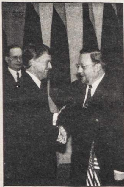
Vice-president Quayle greets Lithuanian President Vytautas Landsbergis upon his arrival in Vilnius, Lithuania.

In the middle of this century, darkness fell upon the peoples of Estonia, Latvia, and Lithuania. Millions suffered at the hand of an oppressive empire. Tens of thousands were martyred, brutalized, and torn from family and homeland. There was tragedy and despair. But the people of Lithuania never gave up hope - the hope of freedom. For, in the words of the Psalmist, "Weeping may endure for a night,