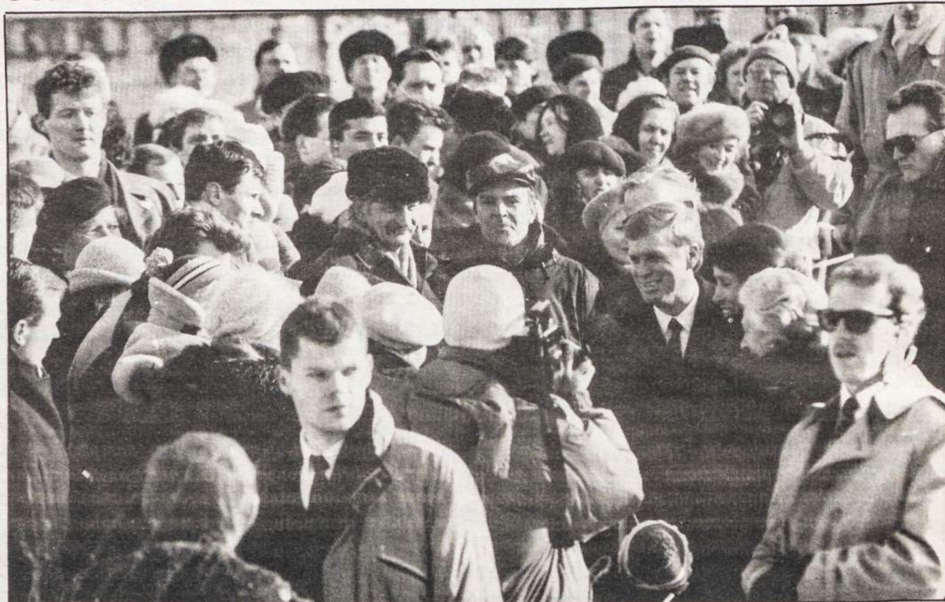
Vice-President Dan Quayle mingles with the Lithuanian people in Vilnius during his recent official visit. His wife, Marilyn, who accompanied the Vice-President can be seen on his left.