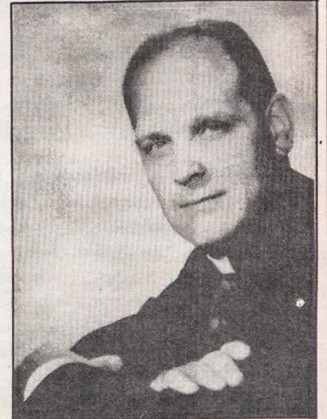
Archbishop Paul C. Marcinkus

Last October, Archbishop Paul retired from his Vatican assignment and now lives in Arizona.