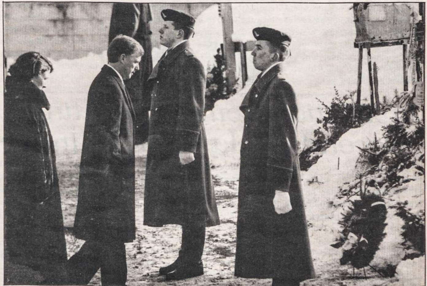
Vice-President and Mrs. Quayle pay tribute to those brave Lithuanians who gave their lives defending the TV tower at Vilnius.