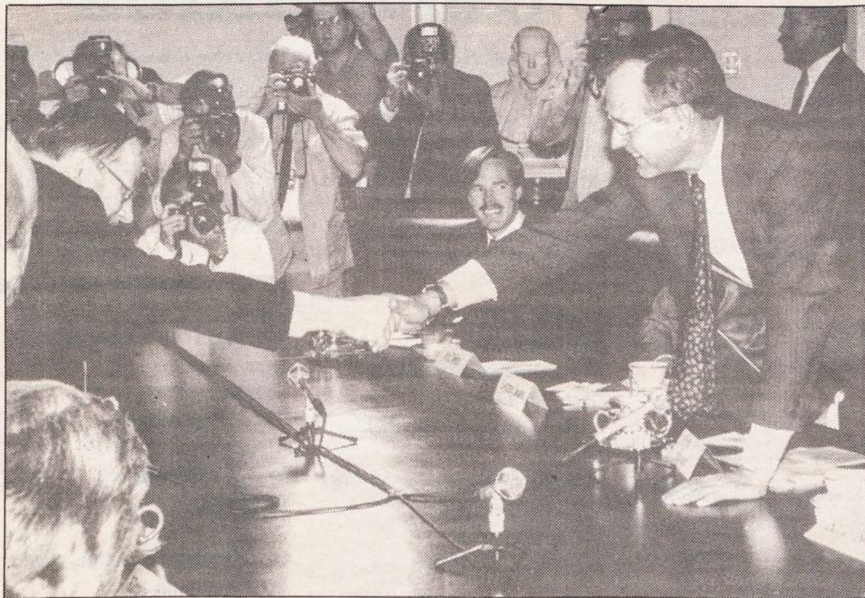
Washington, DC, Baltuosiuose Rūmuose sveikinas prezidentas Vytautas Landsbergis ir prezidentas George Bush.