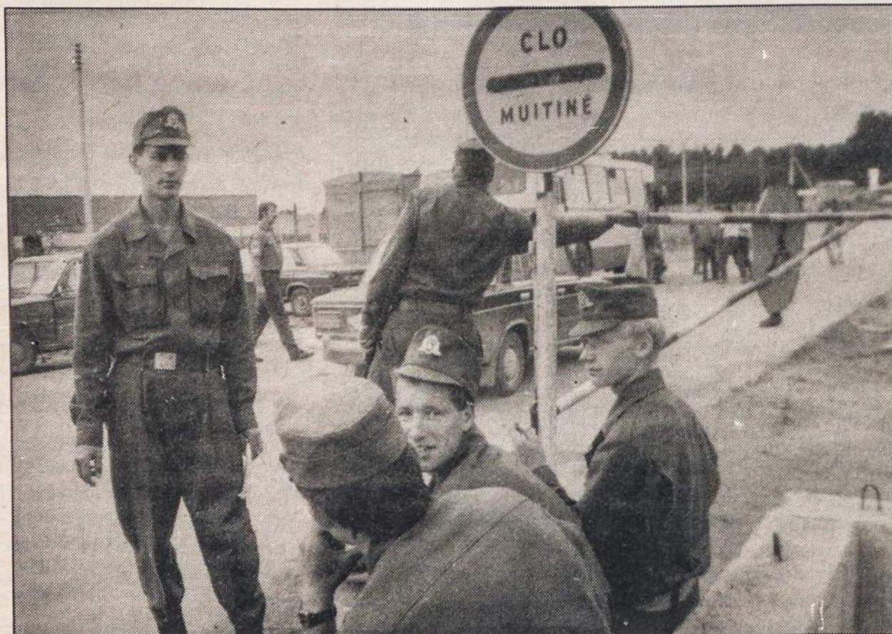
Krašto apsaugos savanoriai saugo Lazdijuose valstybinę sieną.

— Valstybės kontrolieriai , tikrindami Ignalinos jėgainės veiklą, rado maždaug 50 tonų gero popieriaus, ant kurio galima net keturiomis spalvomis spausdinti vadovėlius ir iliustruotus žurnalus. Popierius nebuvo įtrauktas į pajamas. Tai buvęs komunistų partijos turtas.