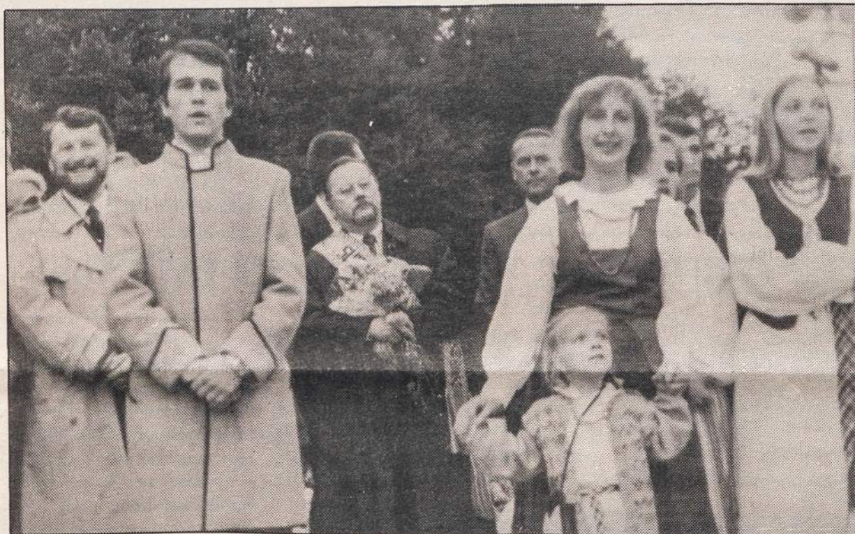
Gedimino šventė Vilniuje. Lietuvos prezidentas prof. Vytautas Landsbergis tarp jaunimo atstovų.

Mažoji Lietuva yra lietuvių tautos ir jos gentainių žemė nuo seniausių amžių. Jokia kita tauta ar valstybė neturi pirmumo teisės į jos teritoriją. Baigiantis karui sąjungininkai pavedė Sovietų Sąjungai Mažąją Lietuvą, įskaitant Karaliaučių (Kaliningrado sritį) laikinai administruoti. Sovietų Sąjunga, piktnaudžiaudama pasitikėjimu, išteriojo arba išvarė to krašto gyventojus, sugriovė ūkį, kolonizavo šalį svetimais žmonėmis ir pavertė ją didžiule ir grėsminga militarine baze. Todėl VLIKo baigiamųjų darbų Seimas kreipiasi į didžiąsias Vakarų valstybes, prašydamas atitraukti visas militarines jėgas iš Mažosios Lietuvos ir sujungti tą šalį su Lietuva.