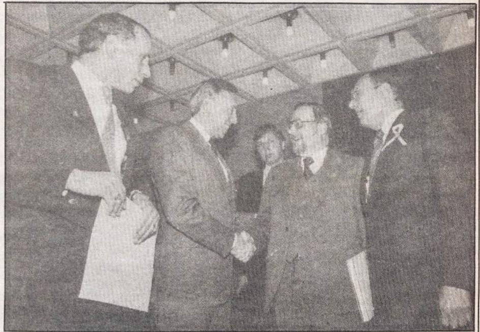
From left, Commissioner Don Ritter (R-PA), Chairman Hoyer and Commissioner Alfonse D'Amato (R-NY) meet President Vytautas Landsbergis in the Lithuanian Parliament building.

A delegation of 13 Members of Congress, led by Helsinki commission chairman Steny Hoyer (D-MD), visited the Baltic states of Latvia, Lithuania and Estonia from February 11-15.