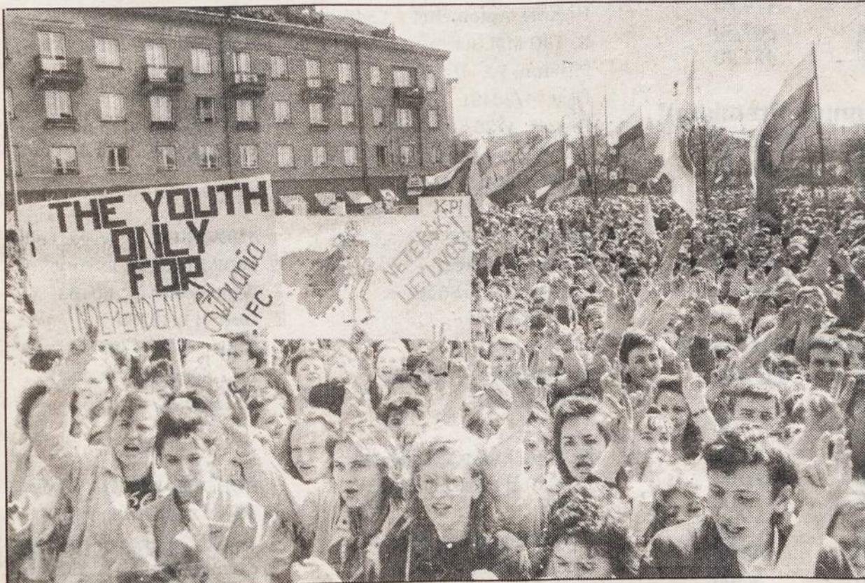
Lietuviai studentai demonstruoja Vilniuje už Lietuvos nepriklausomybę.