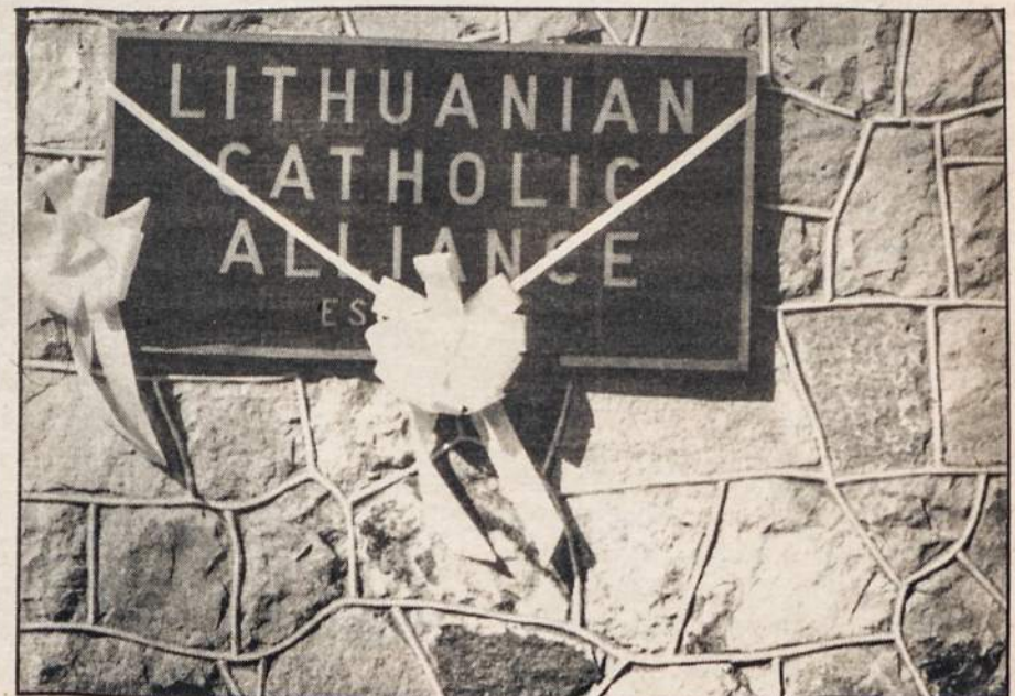
Yellow ribbons fanned by a breeze remind passers-by to remember our brothers and sisters separated from their loved ones.

In an unprecedented move, the state-run Free University of Moscow is setting up a Theology Department to cater to growing religious interest among young Soviets. The department has received more than 200 applications.