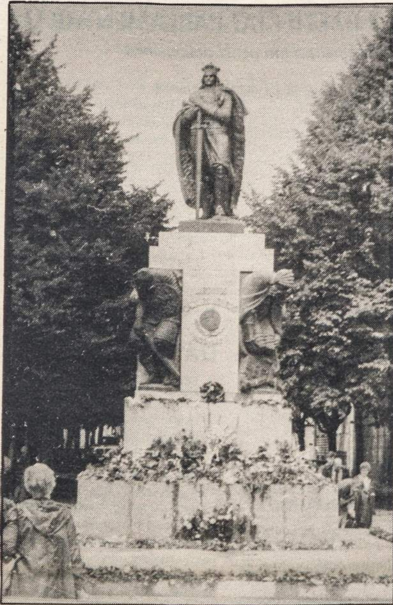
Naujai atstatytas Vytauto Didžiojo paminklas.