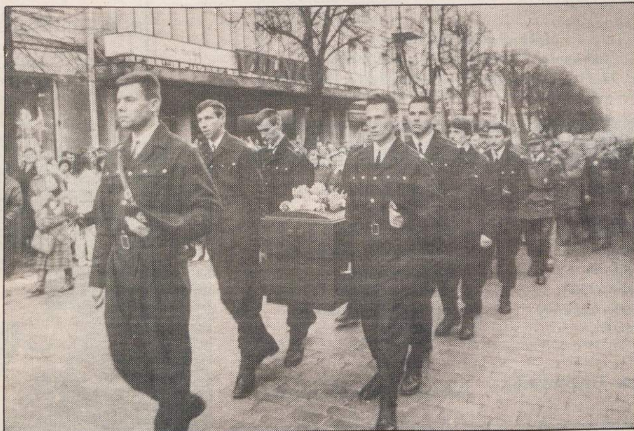
Eitynės Vilniuje minint Lietuvos kariuomenės dieną 1990 lapkričio 23.

Lietuvos Respublikos Aukščiausioji Taryba ir Vyriausybė reikalauja, kad Tarybų Sąjungos vadovybė imtųsi neatidėliotinių veiksmų nutraukti savo ginkluotųjų pajėgų smurtą prieš Lietuvos Respublikos piliečius, o tarnaujančiuosius tarybinėje armijoje grąžinti į Lietuvą. Esame įsitikinę, kad iškilusios problemos turi būti sprendžiamos ne jėga, o tarpvalstybinių susitarimų pagrindu.