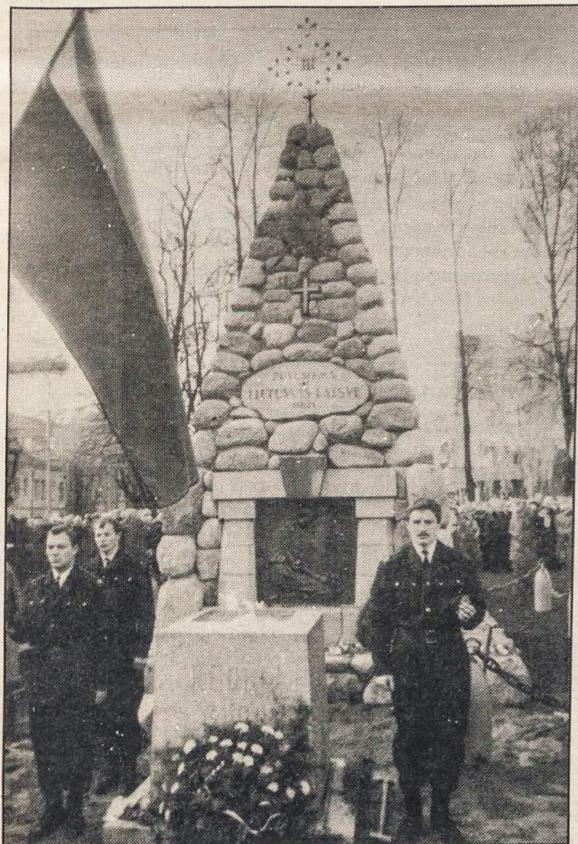
Prie Nežinomo Kareivio kapo Kaune Lietuvos savanoriai 1990 lapkričio 23 d.

— Vilniuje, Mokslininkų rūmuose, įvyko simpoziumas Lietuvos Katalikų Mokslo Akademijos atsteigimo klausimais.