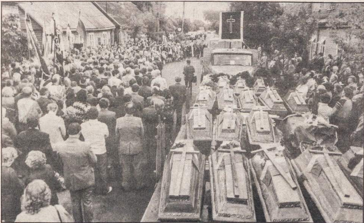
Ariogaloje rugpjūčio 25 rezistencijos aukų laidotuvės. Tūkstančiai ariogaliečių pagerbė 55 Pasipriešinimo sąjūdžio dalyvių palaikų, neseniai surastų Dubysos pakrantėse, ir vieno tremtinio, parvežto iš Intos, atminimą. Laidotuvės vyko ant Dubysos kranto, senosiose kapinėse. Nuotr. V. Kapočiaus