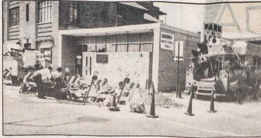
A view of the activity taking place in front of the Home Office following the break in the underground telephone cable.

It took almost two days before all service was restored.