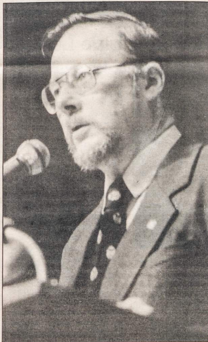
Prof. dr. Vytautas Landsbergis