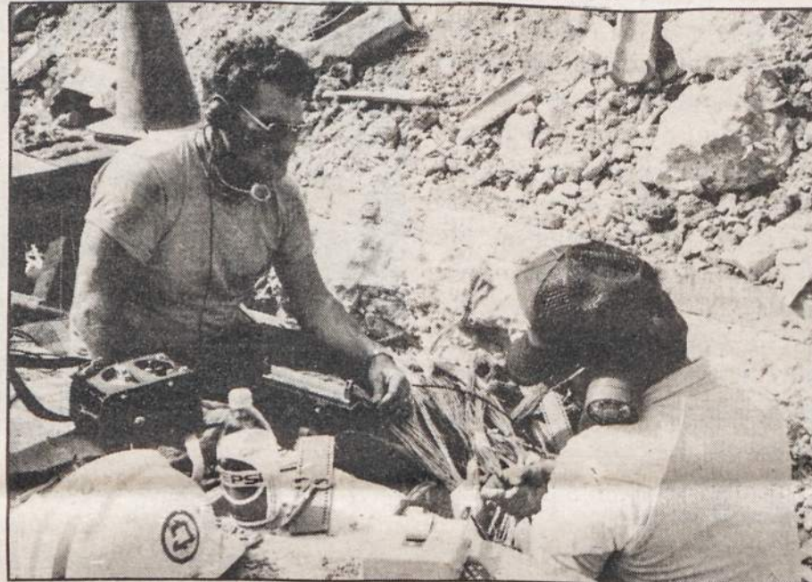
Bell of PA crewman patiently tie each separate wire to restore service to some 1000 customers.