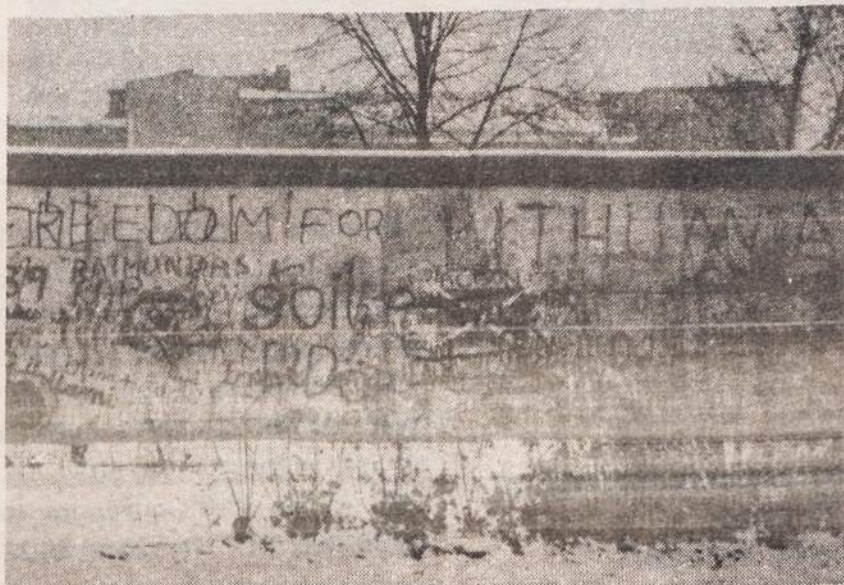
Berlyno siena su parašu: "Freedom for Lithuania".

Tarp parapiečių yra taip pat nemažai lietuvių ir lenkų, o taip pat maža grupė pastaraisiais metais pakrikštytų rusų. Pažymėtina, kad dabar vis daugiau rusų, ypač jaunimo, Šv. Liudviko bažnyčioje Maskvoje priima krikšto Sakramentą.