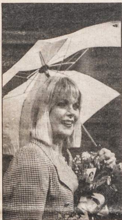
Jillian poses with Lithuanian umbrella and red, green and yellow bouquet

Speaking without hesitation, Ann Jillian credits her survival from a bout with cancer to her faith in God.