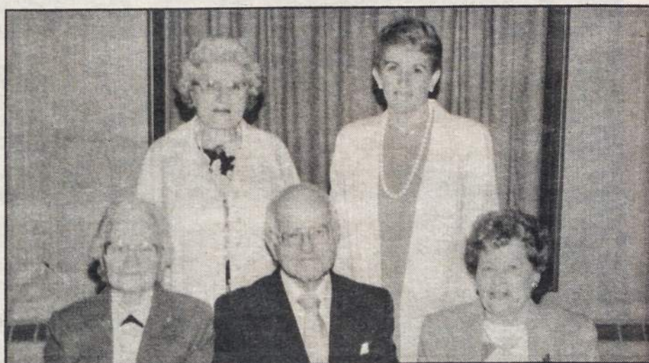
Plans for the Centennial Celebration of St. Casimir's Church, Pittston, PA have been finalized after months of preparation.

For those attending the festival, the Cambria City section of Johnstown is one mile northwest of Johnstown, along route 403.