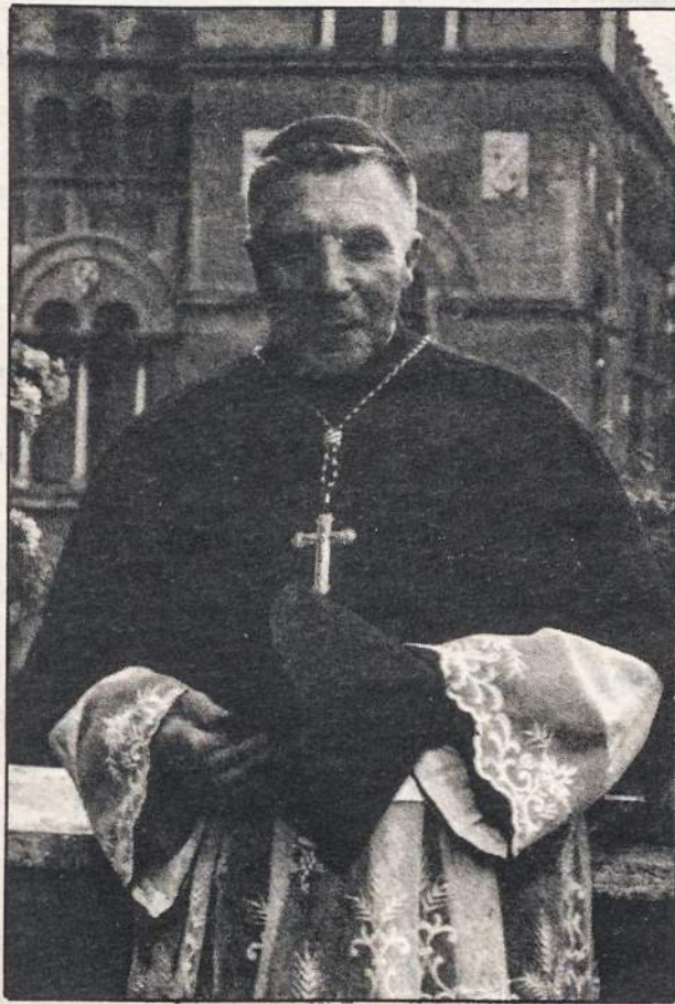
Lietuvos kardinolas V. Sladkevičius

1957 vyskupas T. Matulionis išsirūpino, kad Šv. Tėvas Pijus XII paskirtų šį kanauninką vyskupu padėjėju ir per Kalėdas Birštono bažnyčioje suteikė jam vyskupo konsekraciją. Valdžios įstaigos buvo informuotos apie būsimą konsekraciją, bet pritari-