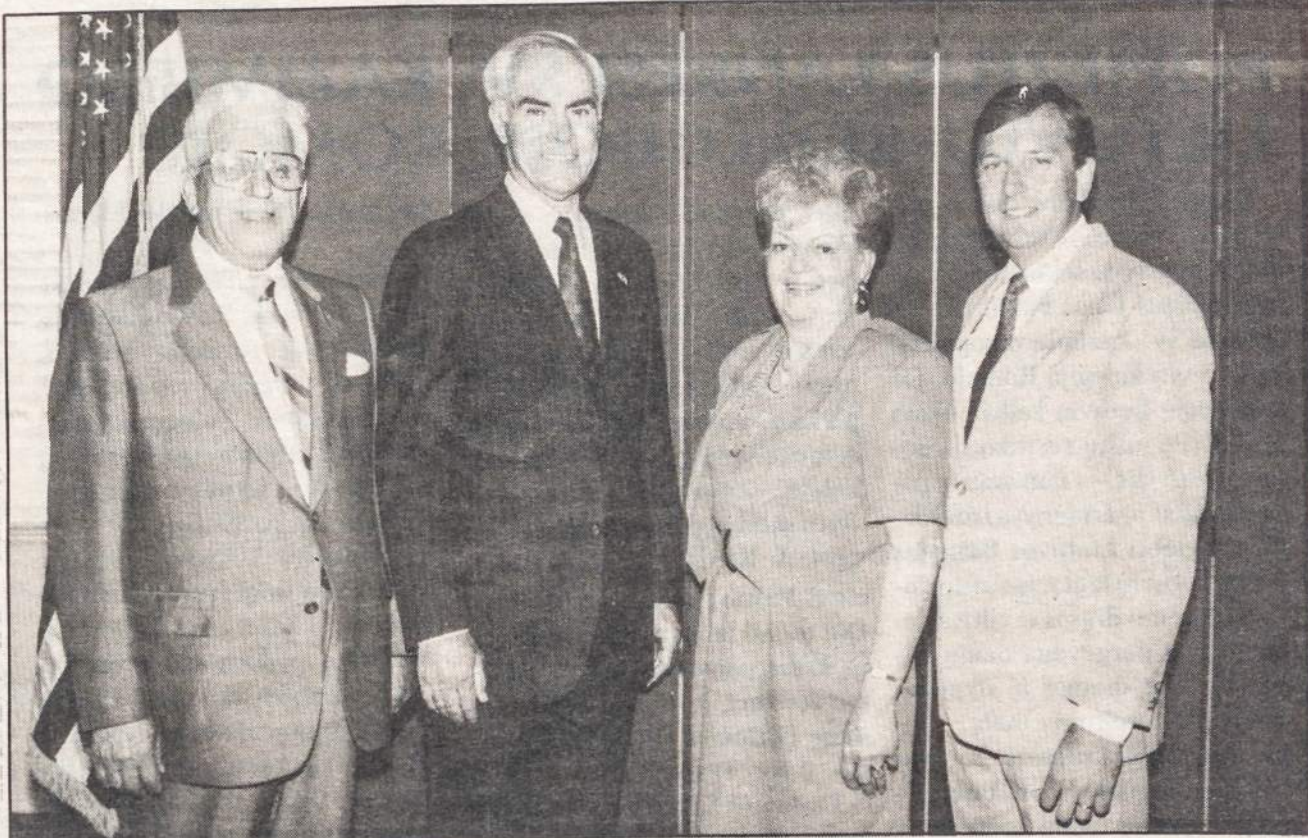
Pennsylvania Governor Robert P. Casey recently signed a Fraternal Proclamation at the Governor's Mansion in Harrisburg. In his proclamation, the Governor cited Pennsylvania as the nation's most active "fraternal state," with the largest ongoing membership in the country.

The proclamation notes, "The Organization began more than a century ago when immigrant families banded together for fellowship and to look out for one another.