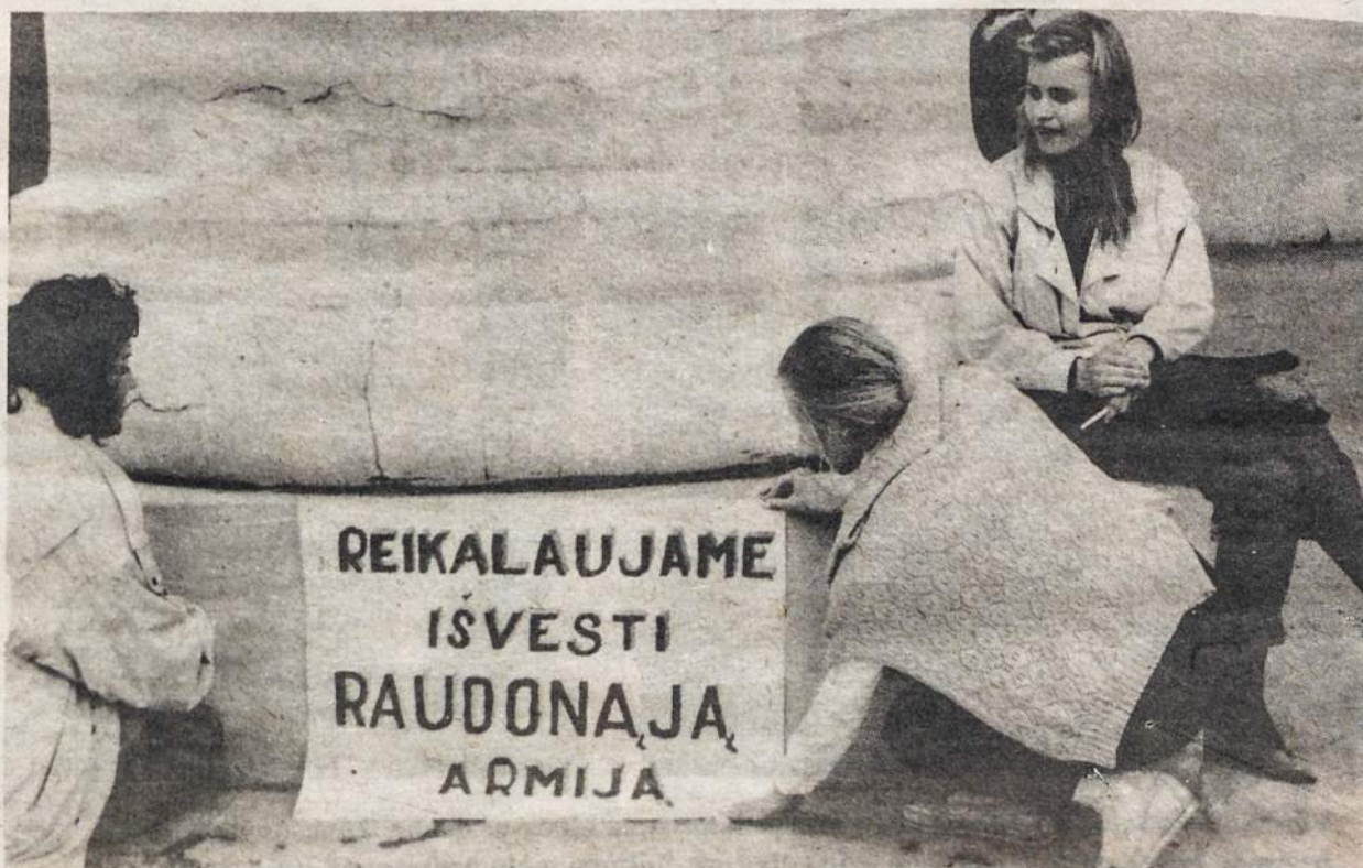
Demonstracijų plakatas prie Vilniaus katedros.