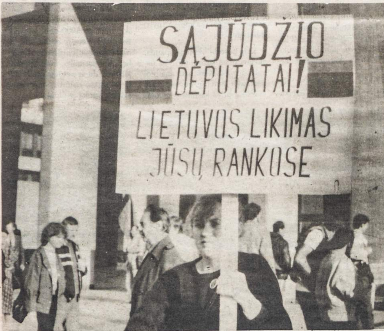
Vilniuje prie Sąjūdžio būstinės nešamas plakatas apie Lietuvos likimą. Panašūs plakatai pasirodo beveik kiekvieną dieną prie katedros, mitingo metu įvairiose aikštėse.

Pasitarimuose dalyvavo Čekoslovakijos, Jugoslavijos, Vengrijos, VFR, Olandijos, Prancūzijos ir kitų šalių atstovai. Į organizacinį ir konsultacinį komitetą yra pakviesti Vytautas Landsbergis ir Andriejus Sacharovas, kurio tikimasi susilaukti konferencijoje. (Elta)