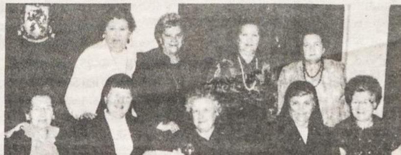
LITHUANIAN WOMEN'S CLUB HOLDS YULE FETE — Lithuanian Women's Club held a Christmas Party at the Golden Palace, Wilkes-Barre, PA. Gifts were exchanged and games played.