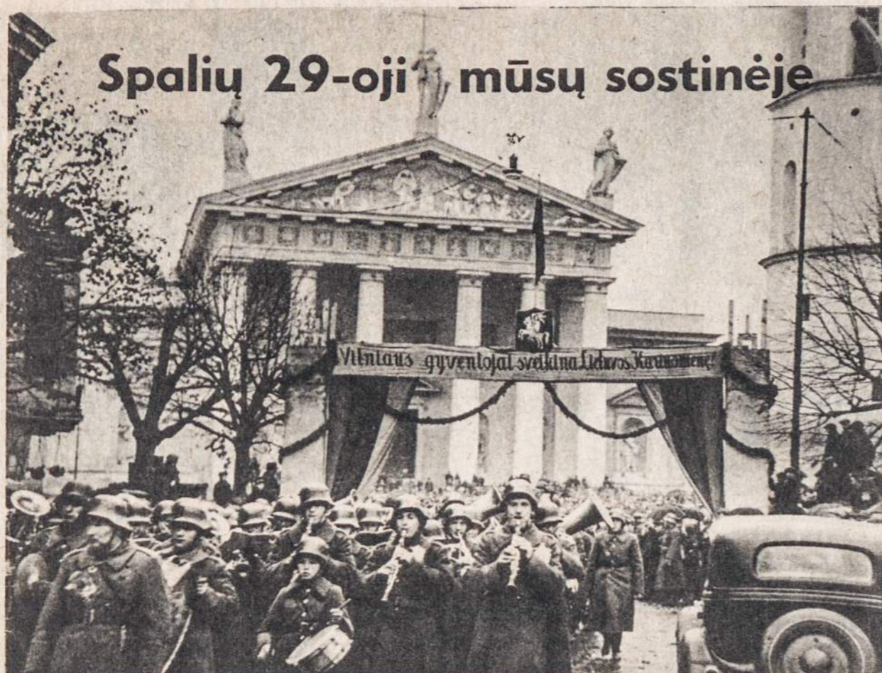
Prieš 40 metų, 1939 metais spalio 29 Lietuvos kariuomenė įžygiavo į Vilniaus kraštą ir į Vilniaus miestą. Vilniaus lietuviai jai pasitikti pastatė daug kur gražius varstus. Tokie vartai buvo ir prie Vilniaus katedros.