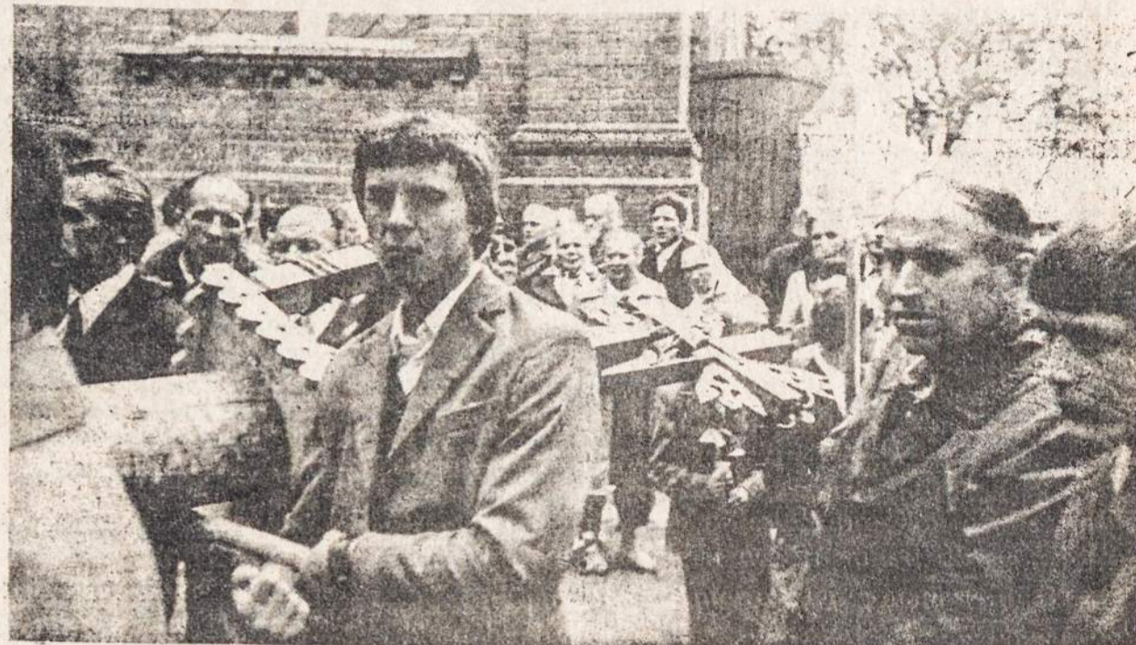
Jaunimas neša kryžių į Kryžių kalną šiais metais liepos 22 Meškuičiuose.

maturgijai. Vis dar nesulaukia pakankamai gilaus ir visapusiško įprasminimo tokios reikšmingos temos, kaip revoliucinė darbo žmonių kova, tarybinės liaudies žygdarbis Didžiajame Tėvynės Kare, komunistinės moralės, ateistinio auklėjimo klausimai, trūksta įvairių gamybinės tematikos kūrinių. Reikia visokeriopai skatinti mūsų dramaturgus kurti pjeses šiomis temomis... Reikia stiprinti... partinių organizacijų vaidmenį kūrybinėje teatrų veikloje. Didesnius reikalavimus reikia kelti idėjiniams ir meniniams einamojo repertuaro spektaklių lygiui... Teatrų kolektyvuose reikia stiprinti idėjinį darbą, politinį švietimą... Tokia "tarybiška" ateitis numatoma Lietuvos teatrui. (Elta)