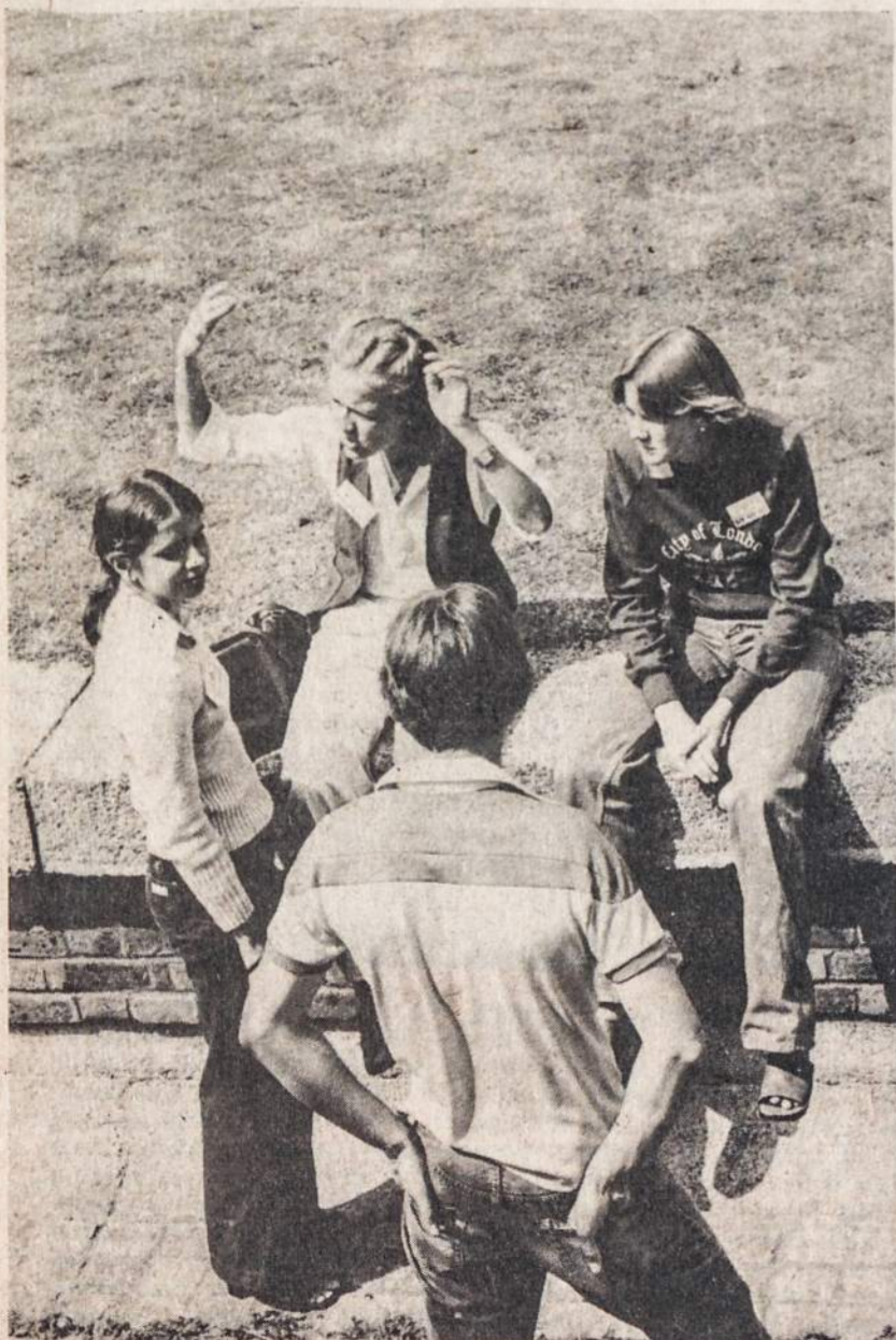
Young Lithuanians from Colombia engage in a heated discussion.