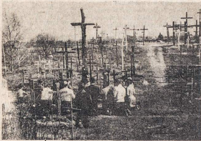
Apnaikintas Kryžių kalnas 1977 metais. Tais metais gegužės mėn. žmonės pastatė naują kryžių iš nupiauto klevo — (pats aukščiausias kairėje). Pastatę meldžiasi suklaupę.