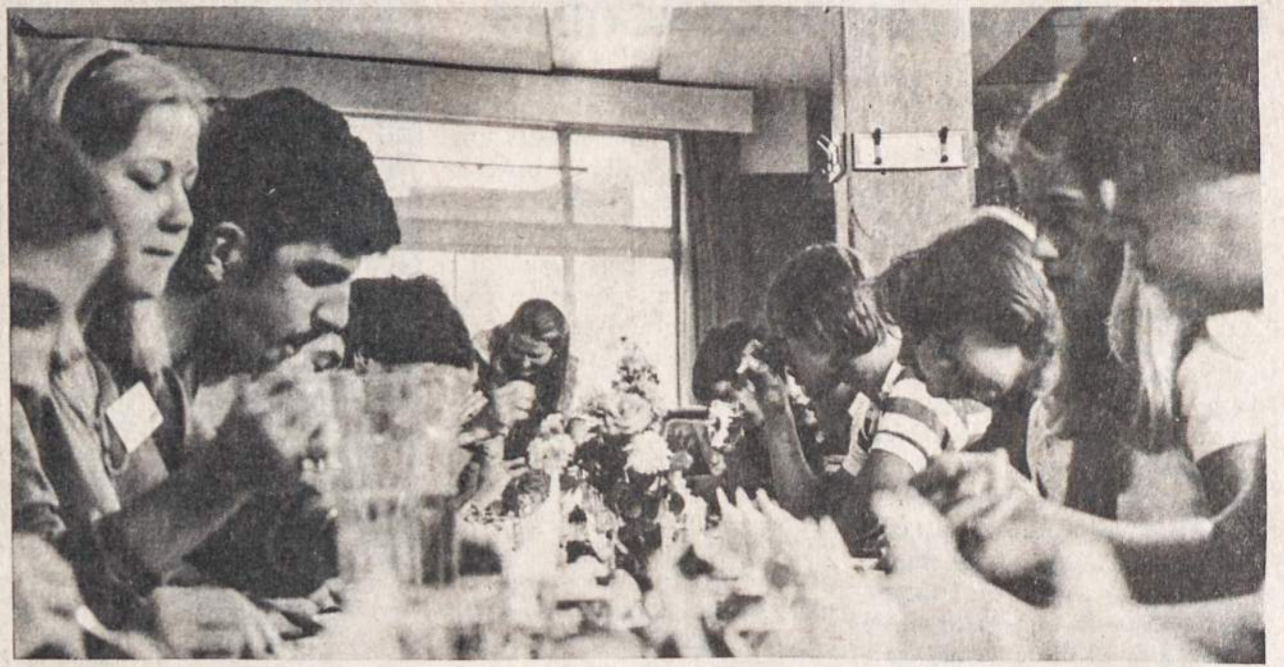
Meals were prepared and included lots and lots of potatoes — "Chips anyone?"