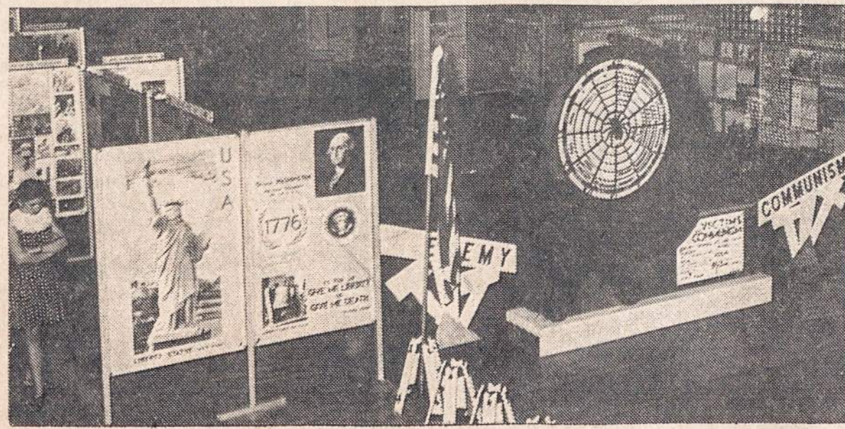
A view of the Genocide Exhibit produced by the Lithuanian American Council in the Sheraton Hotel of Chicago, on display from June 13th. The exhibit documents the progress of Soviet genocide in captive countries.