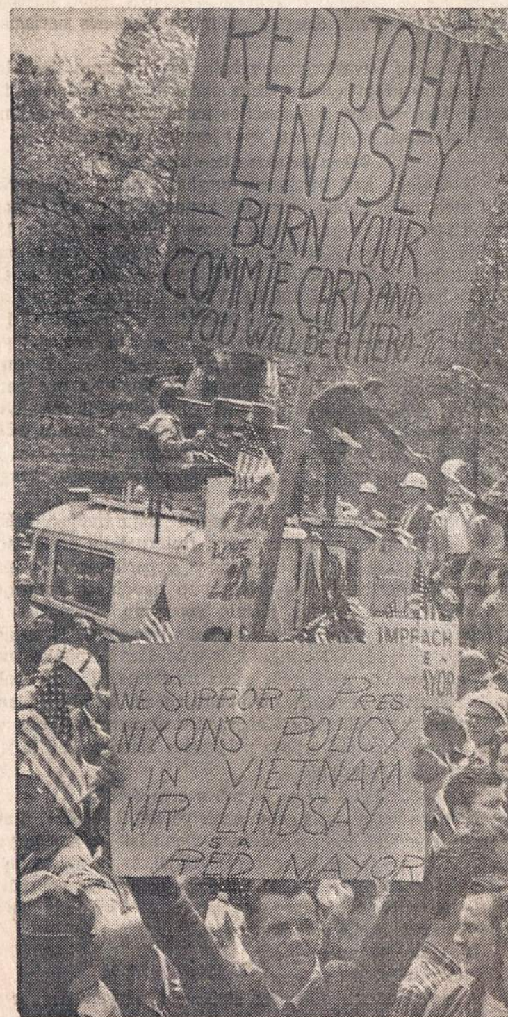
Vaidžiai iš gegužės 20 demonstracijų, kurios buvo surengtos "tyliosios daugumos" ir nukreiptos prieš New Yorko burmistrą Lindsey, prieš triukšmaujančius studentus.

Lietuvos atstovas J. Kajeckas, š.m. gegužės 20 d. dalyvavo pagerbime Valstybės Sekretoriaus, p. William P. Rogers, kurį jam surengė diplomatinis misijų šefai.