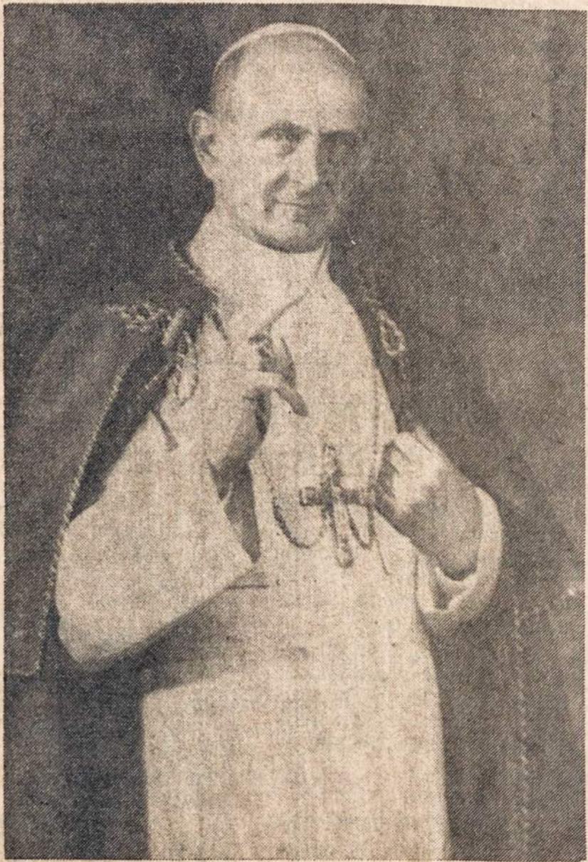
POPIEZIUS PAULIUS VI-SIS š.m. gegužio 29 minėjo 50 metų kunigystės sukaktį