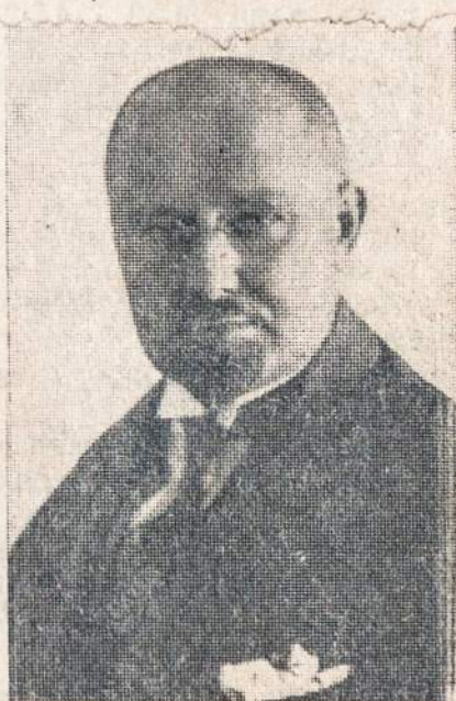
A. a. Aleksandras Stulginskis