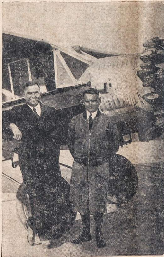
Capt. Steve Darius and Stanley Girėnas

The two Lithians left a goal for their countrymen to shoot at. It was a goal they were unable to surpass. But it inspired them to work and strive and progress in all fields. They are the inspiration of an enslaved nation in its fight for freedom today.