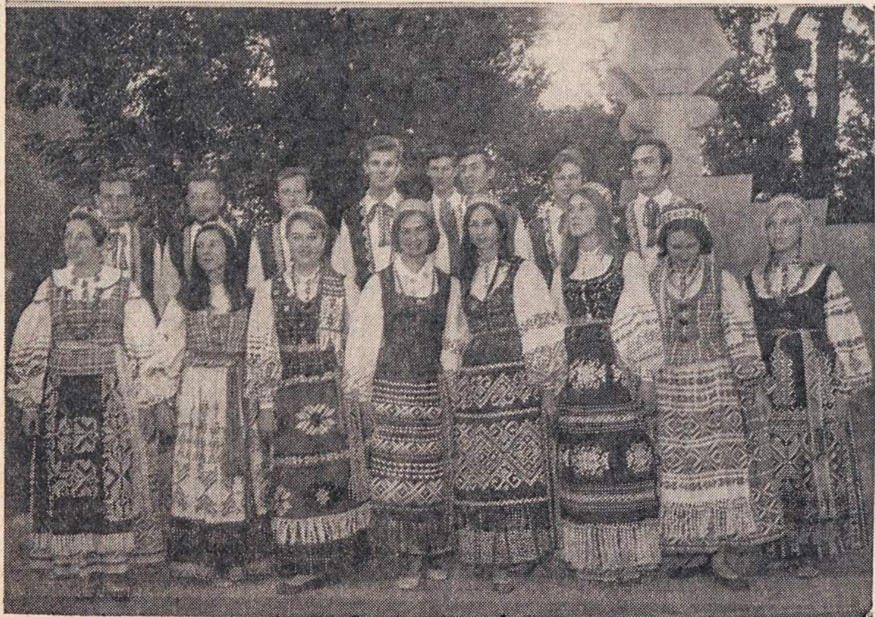
Urugvajaus lietuvių tautinių šokių grupė “Gintaras” Jaunimo Centro sodelyje Chicagoje.

P.O. Box 32 (71-73 So. Washington Street) Wilkes-Barre, Pa. 18703