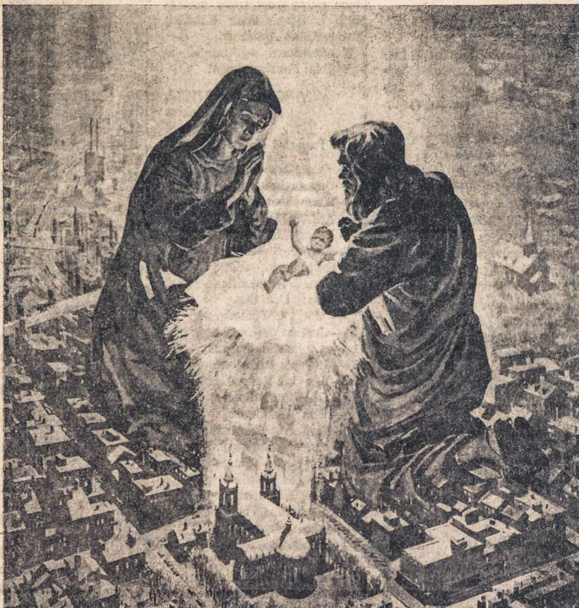
"KRISTUS UZGIMĖ — LINKSMA GADYNĖ! ..."