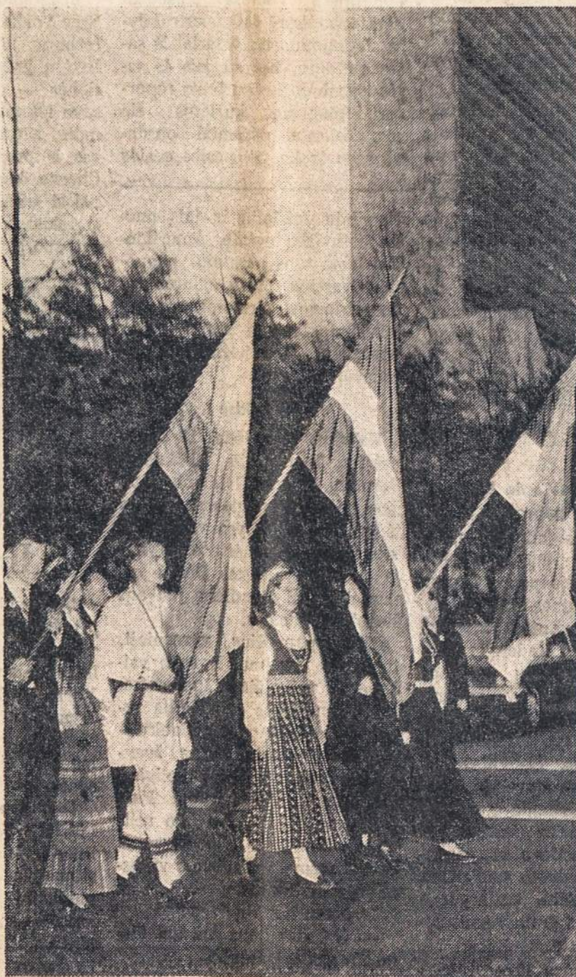
VELIAVOS PRIE JT VARTŲ simboliškai reiškę įleisti...