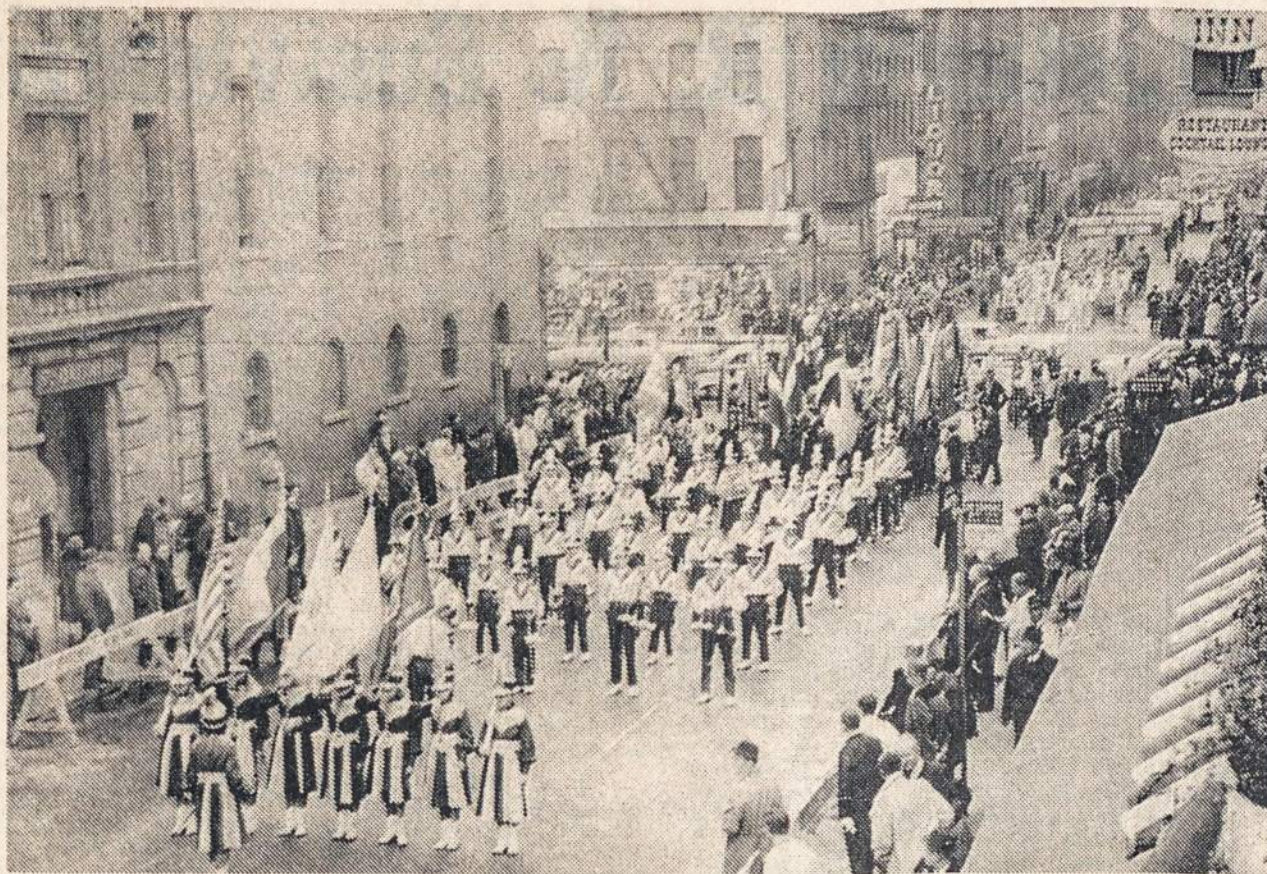
SV. PETRO parapijos So. Bostone orkestras žygyje.