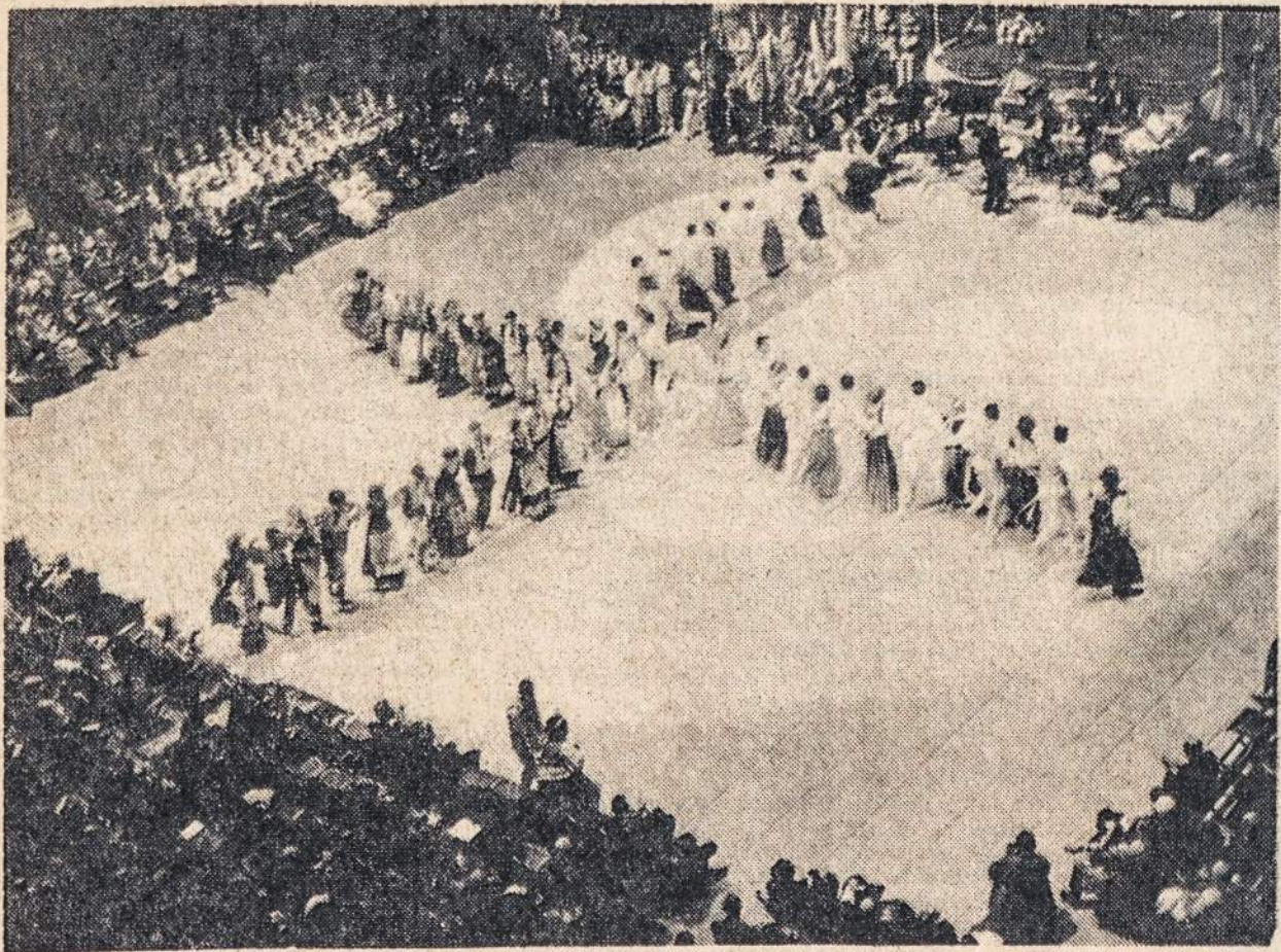
JUNGTINĖ tautinių šokių grupė šoka malūnų Madison Sq. Garden lapkričio 13.

Where there is hatred, let them sow love.