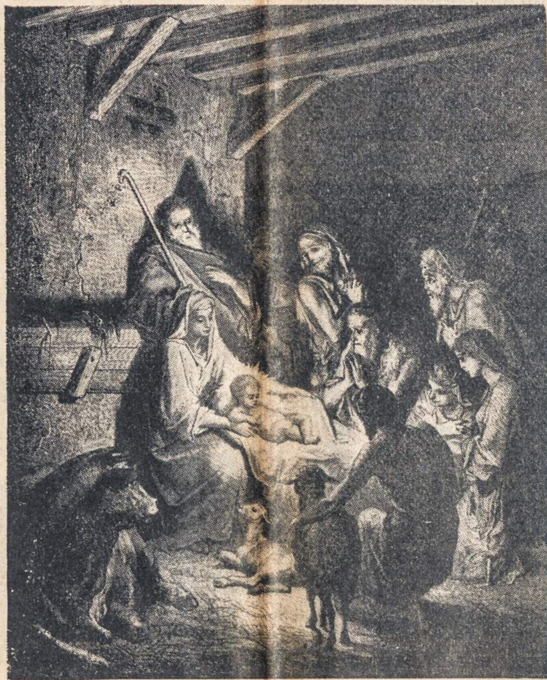
SVENTOJI NAKTIS — PIEMENELIAI PASVEIKINO GIMUSĮ KRISTŪ.

Visos ir visi skirstėsi geroje nuotaikoje imtis konkretaus darbo Susiv. Sukaktuvių metų atžymėjimui.