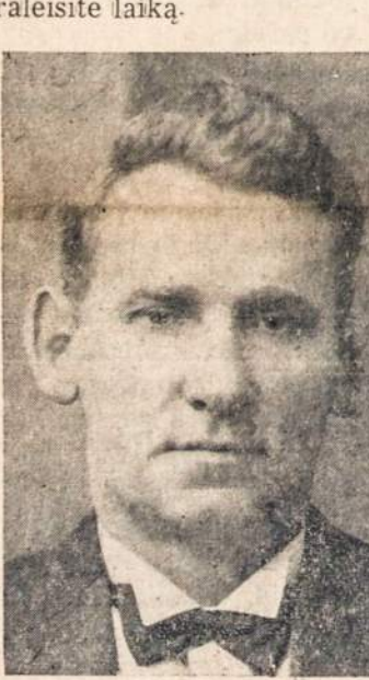
MUZ. JOK. VARAITIS Jungtinio choro dirigentas

š.m. liepos 4. Paliko tėvą ir kitus artimuosius.