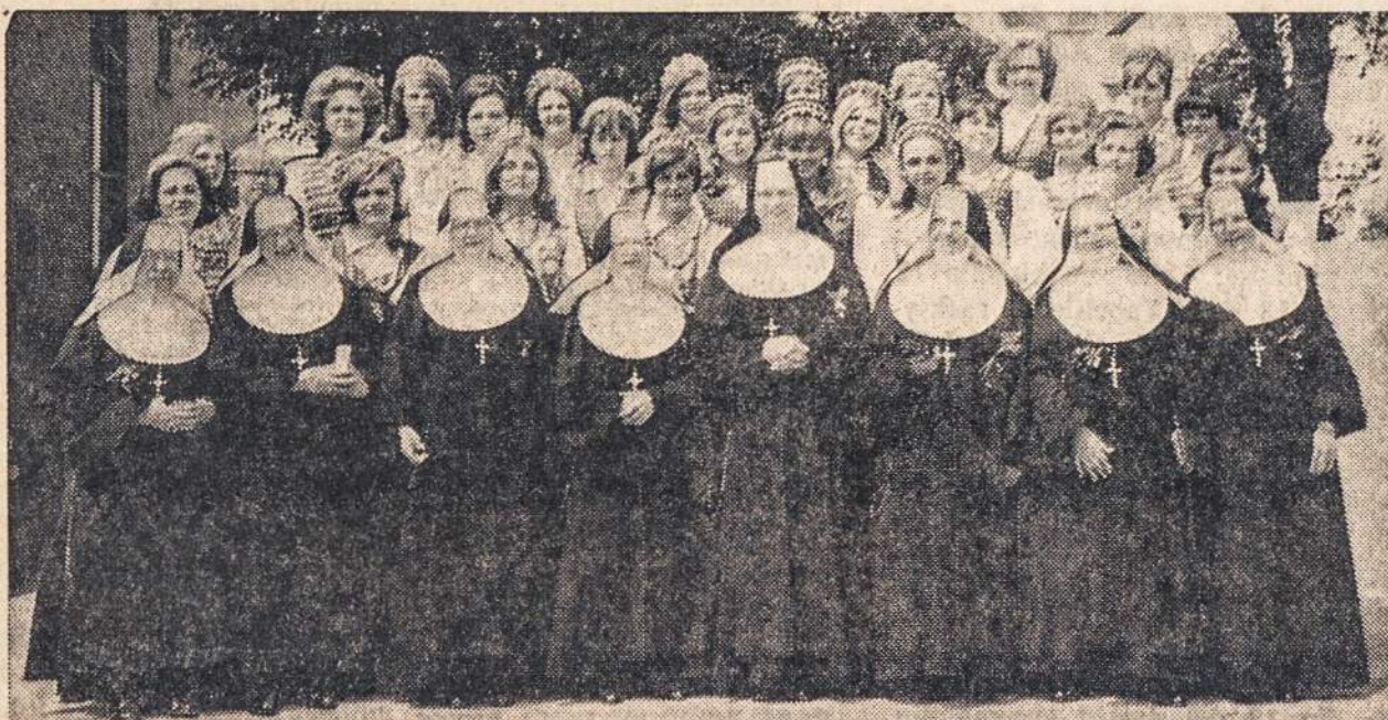
š. m. birželio 6 d. Chicagoje prie žuviesiems už Lietuvos laisvę paminklo, Jaunimo Centre, Marijos Aukštesniosios mokyklos "Rūtos" ratalio abiturientės, kartu su kazimierietėm seselėm mokytojoms pagerbė Lietuvos kovotojų ir kankinių atmintį.

Knygos kaina 6 doleriai. Galima gauti "Garsu" administracijoje, P.O. Box 32 (71-73 So. Washington str.), Wilkes-Barre, Pa.