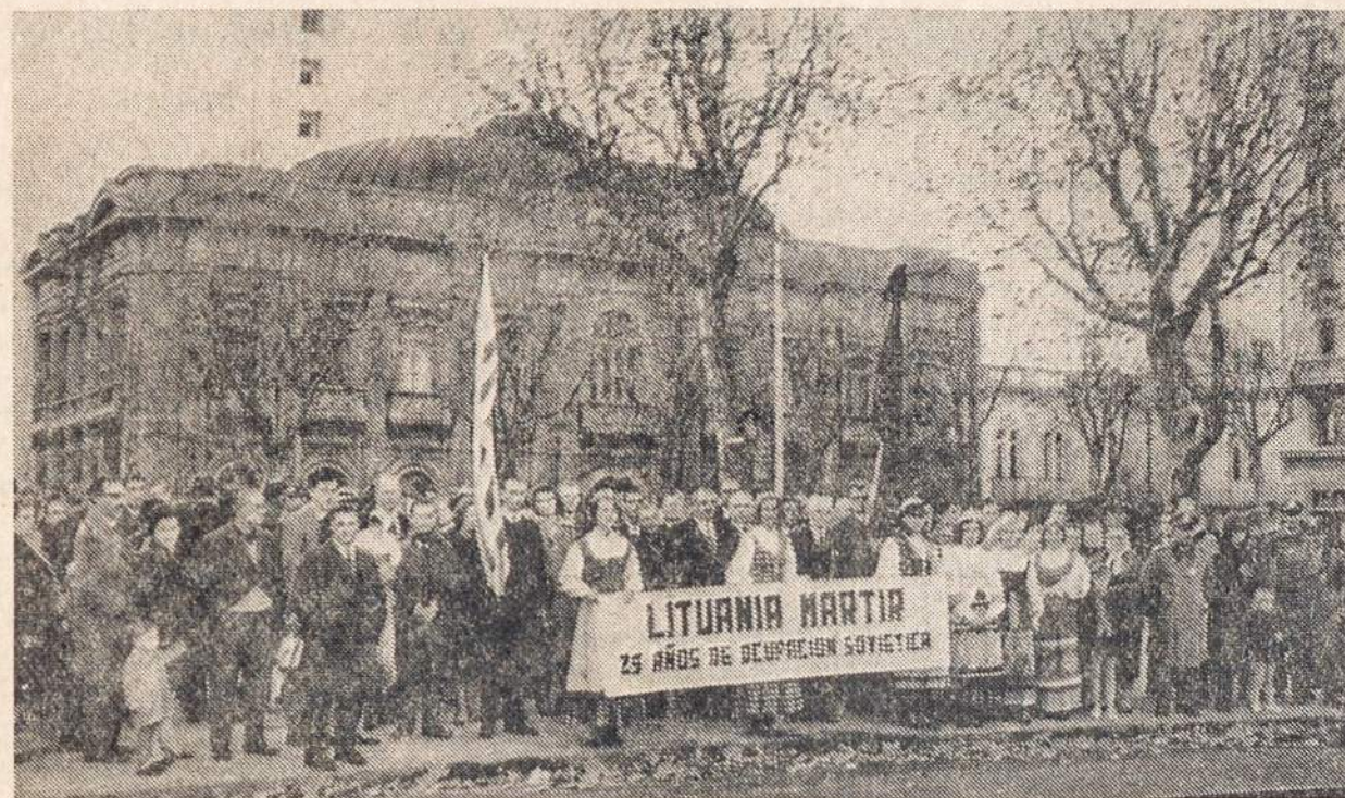
URUGVAJIAUS lietuviai prie laisvės paminklo, kur padėjo vainiką. Gilumoje Ateneo rūmai, kuriuose buvo surengtas minėjimas.

Dantistas motinai: "Dabar jūsų berniukui užtaisys dantis, ir žiūrėkite, kad bent valanda nieko neįkastų".