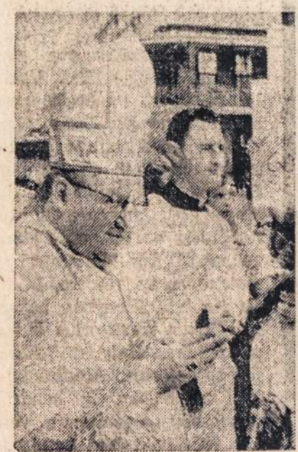
VYSK. JOHN PATRICK CODY paskirtas naujas Chicagos arkivyskupas.

Raudonieji rusai ir kinai neslepia, kad teritorijų ginčas yra gyvas ir opus ir kad laikui bėgant jis paastres. Anot dzukų išsireiškimo — "Draugas ne draugas — lipk iš grūšios". Lai kinai šias dvi šalis neva suartina komunistiniai ryšiai, planai ir svajonės pajungti komunistui visą pasaulį, bet kuo toliau tuo stipriau pasireiškia Pe-