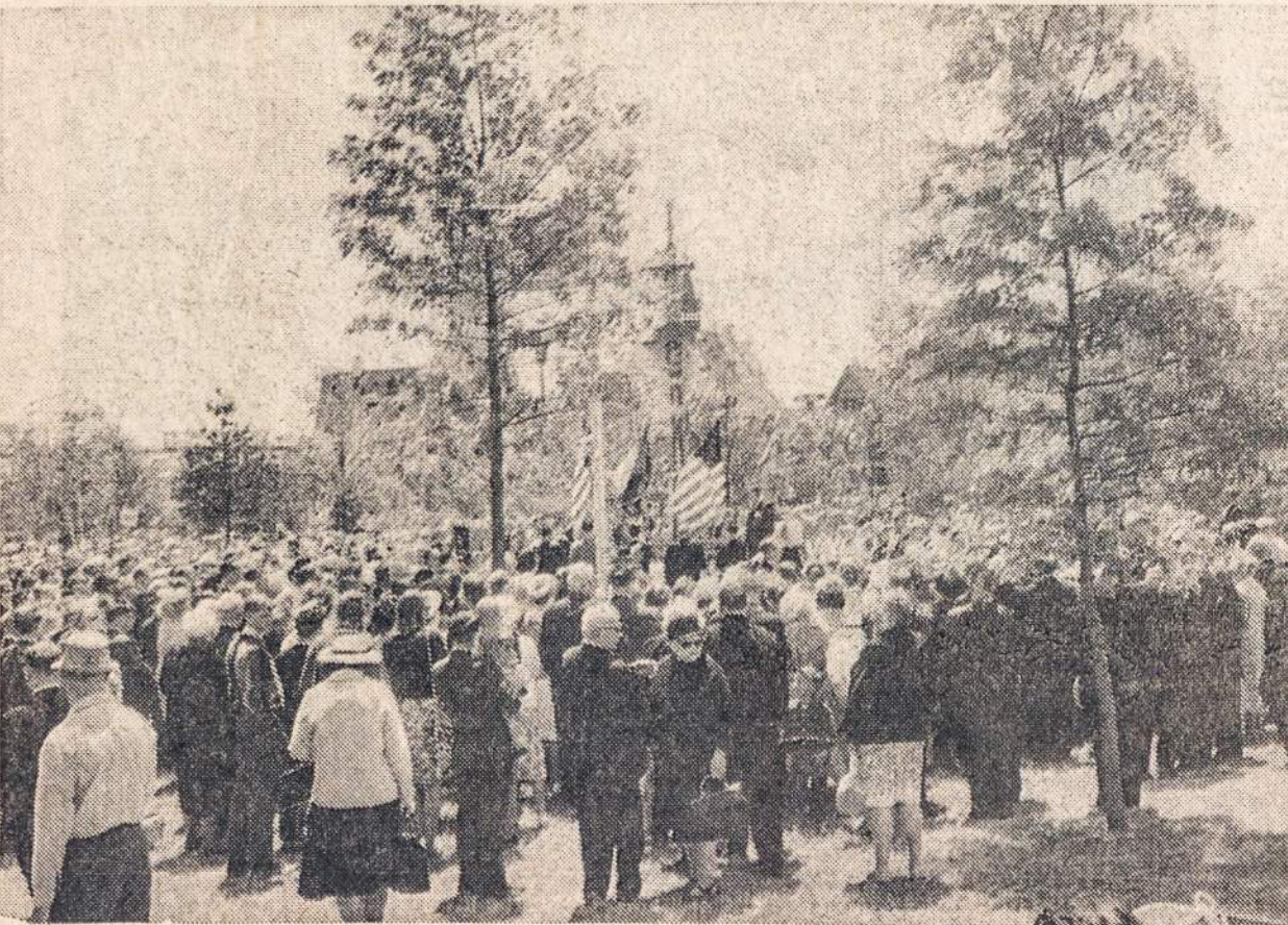
Tūkstančiai dalyvių birželio 13 iškilmėse prie Kryžiaus New Yorko parodoje

Pragyvenimas Italijoje pasku- tiniu metu žymiai pabrango. Tik kasdienei duonai, reikia pusantro dolerio vienam moks-