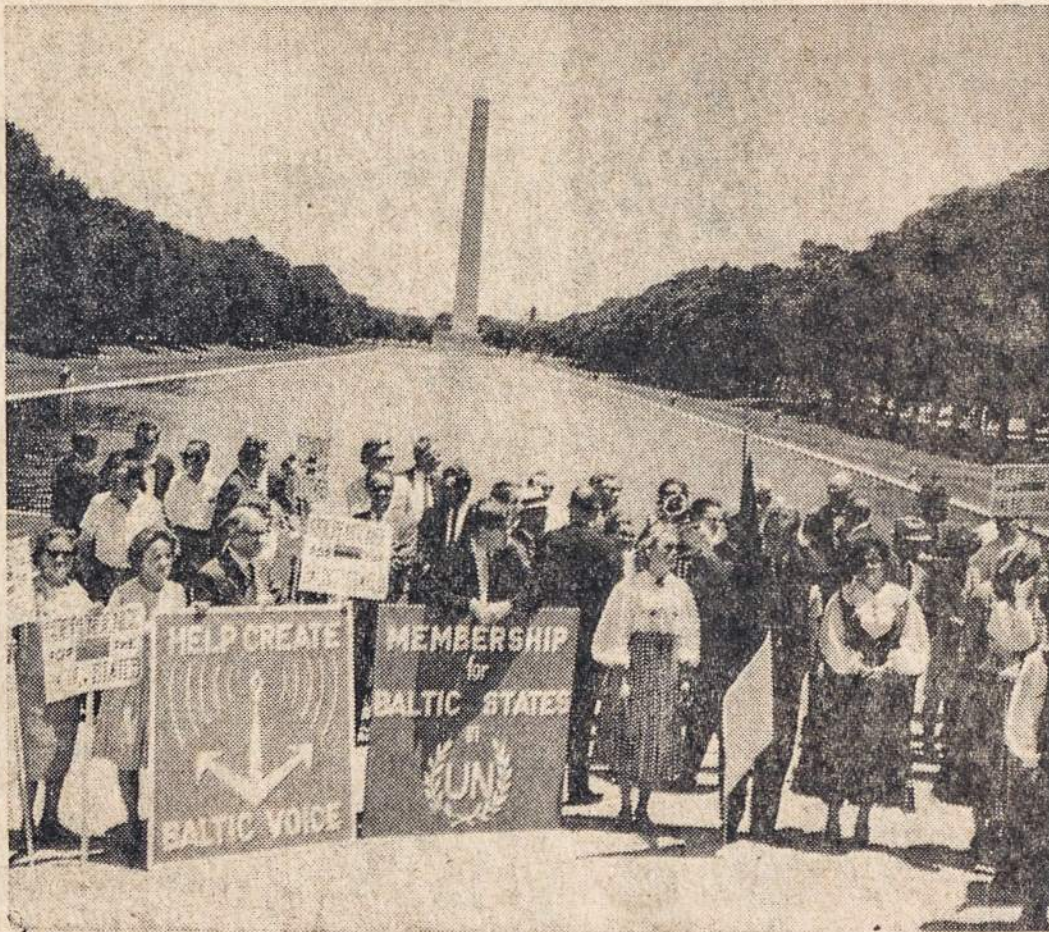
Dalis pabaltiečių birželio 13 dalyvavusių protesto demonstracijoje Washington, D. C.

P.O. Box 32 (71-73 S. Washington St.), Wilkes-Barre, Pa.