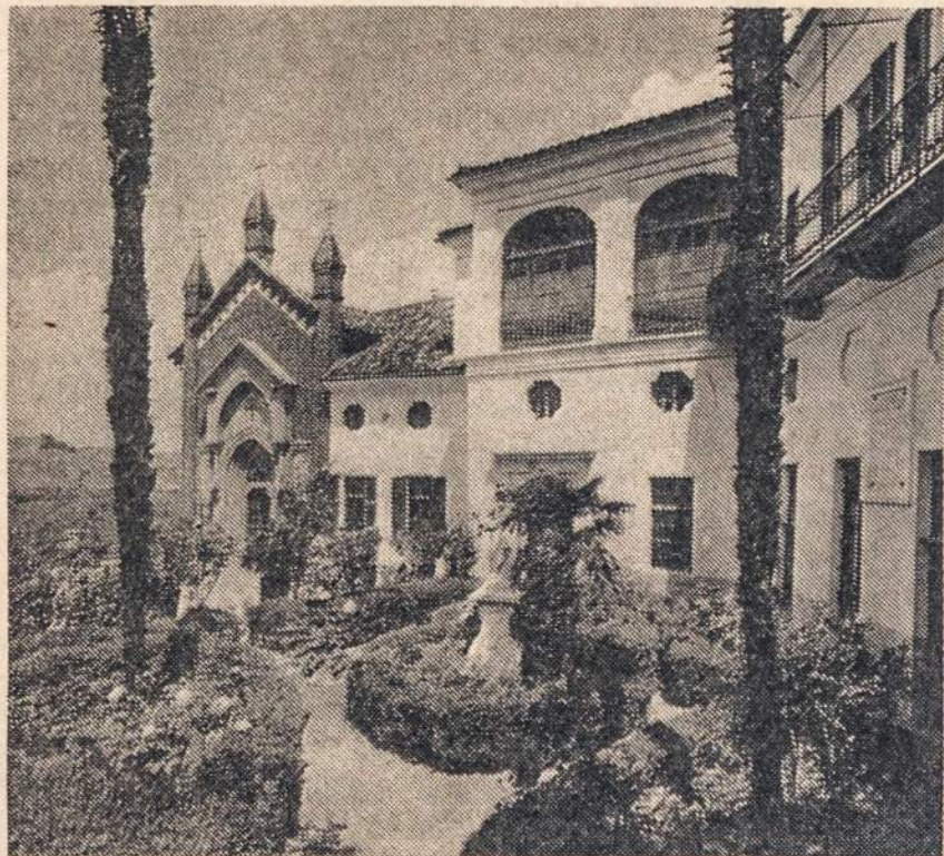
Lietuvių saleziečių įstarga Italijoje

Šiais metais Lietuviškoji Mo- kykla ir Spaudos Studija Cas- telnuove, Italijoje, įžengė į 14- tuosius gyvavimo metus tremty- je.