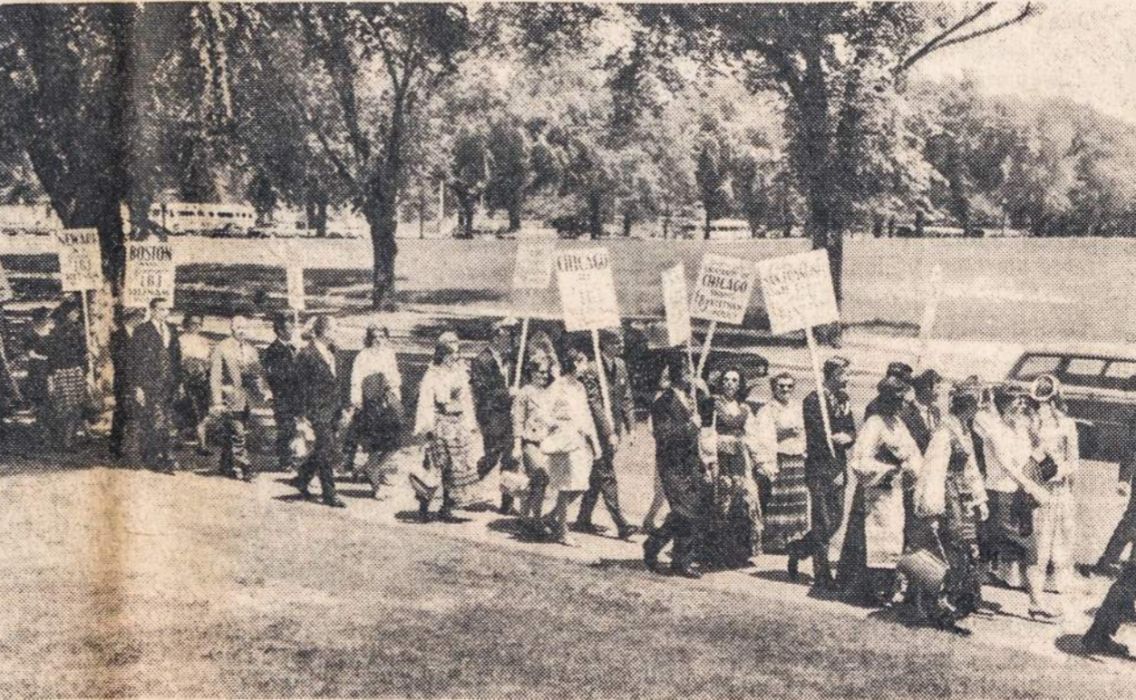
Gegužio 15 lietuvių demonstrantų eiseną prie Lincoln paminklo, Washington, D.C.

Gegužės 3 d. iš Vilniaus į Bulgariją gastrolems išvyko Vilniaus universiteto dainų ir šokių liaudies ansamblis (iš viso 110 studentų). Jie laivu iš Odosos nuvyko į Varną ir iš jos auto mašinomis apsilankė Sofijoje, Plevene ir kituose miestuose. Anksčiau ansamblis yra keliavęs po Čekoslovakiją, Lenkiją ir Vengriją.