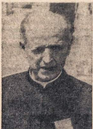
Pedro Arrupe išrinktas jėzuitų ordino "generaliniu tėvu". Ispanas, jėzuitų provincijolas Japonijoje, 1945 buvo naujojo viršininkas 5 mylios nuo Hiroshimos, kai į ją buvo numestas pirmas atomas.

Dėja, raudonieji atlikę negirdėtus genocidinius darbus, šiais metais rengiasi iškilmin-