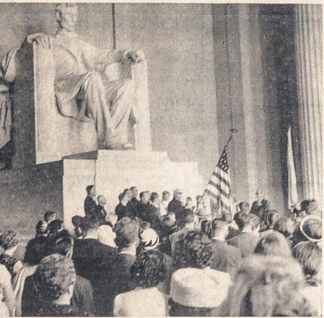
Lietuviai demonstrantai prie Lincoln paminklo