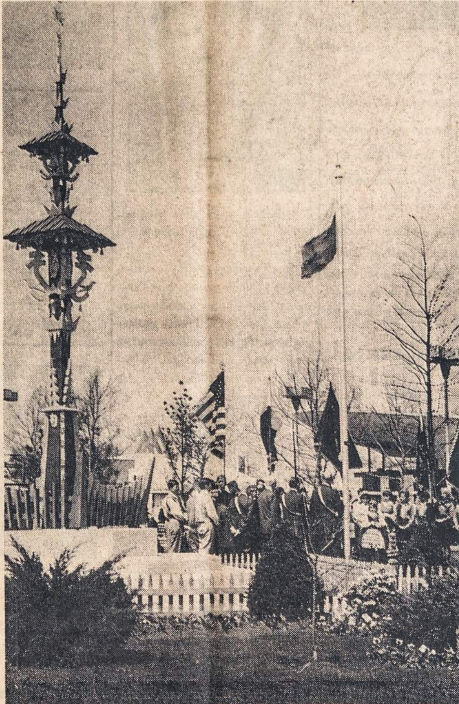
Lietuvos vėliava kryžiaus aikštelėje pasaulinėje parodoje New Yorke.

Nekaltai Pradėtosios Marijos Seserų ir Rėmėjų Gildos Centro Valdyba