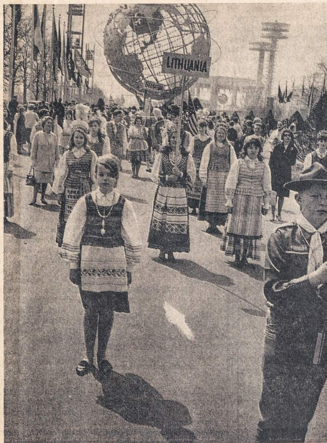
LIETUVIAI Pasaulinės Parodos parade s. m. balandžio 21 d.

SEOULAS, Pietų Koreja — Balandžio 17 įvyko didelės demonstracijos ir riaušės dėl vyriausybės priimtų sutarties su Japonija. Keli šimtai riaušinių ir policistų sužeista. Opozicija priešinga sutarčiai, kačangi Japonija valdydama Koreją vartoja žiauriausias priemones. Demonstracijose ir riaušėse gyvai pasireiškia parlamento opoziciniai atstovai ir studentai.