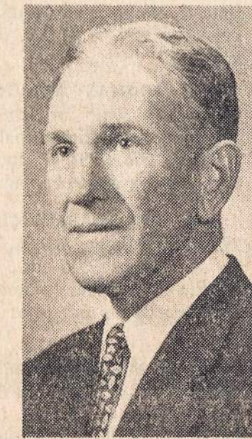
SALIAMONAS BEKAMPAS išvažiavimo šeimininkas