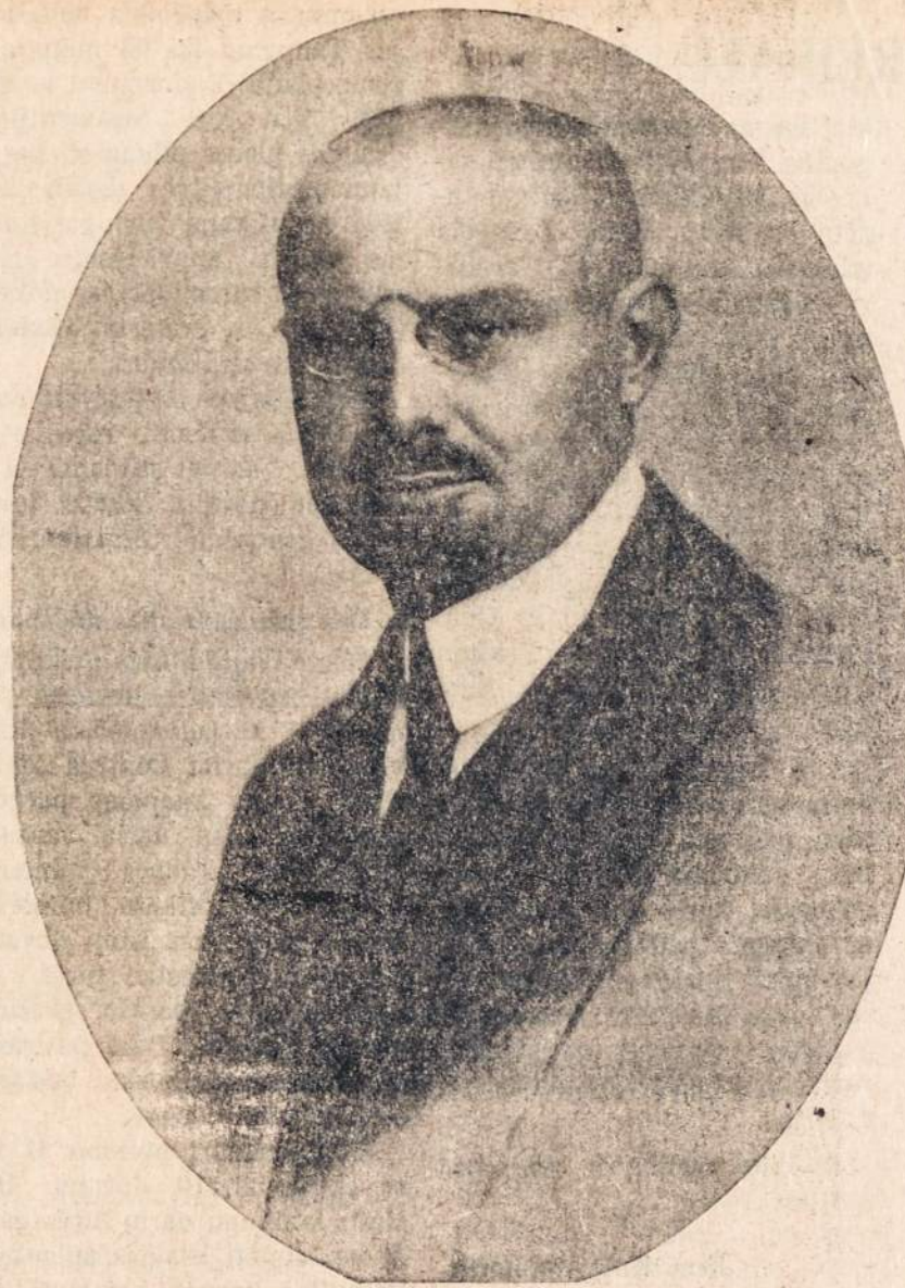
SUKAKTUVININKAS ALEKSANDRAS STULGINSKIS

Vasario 16-sios Akto signataras, buvęs Lietuvos Steigiamosios Seimo pirmininkas ir antrasis Liet. respublikos prezidentas, šių metų vasario 27 d. sulaukęs 80 metų amžiaus.