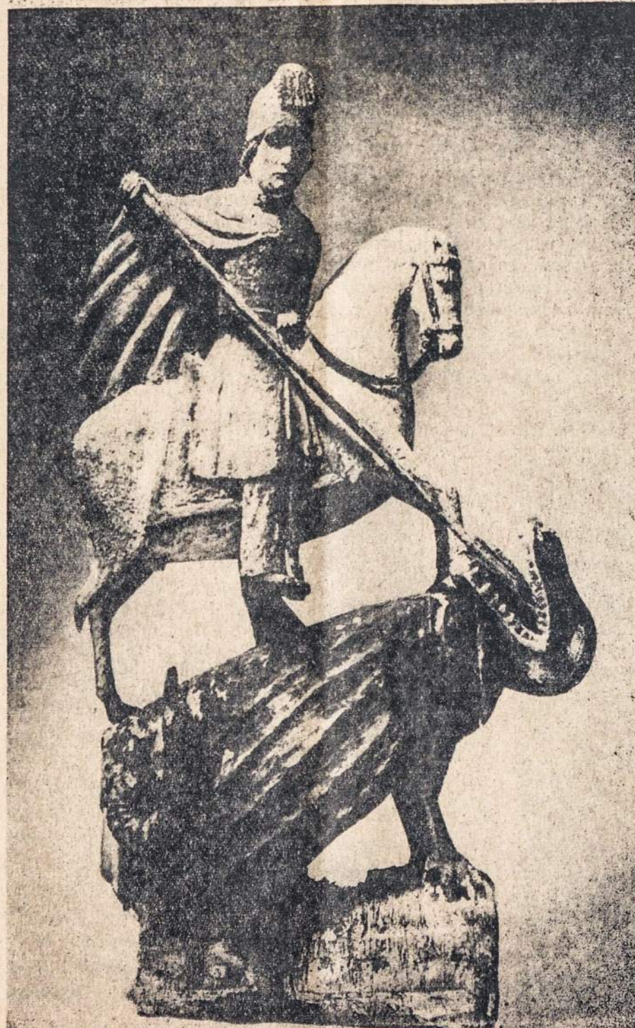
SV. JURGIS ietimi nugali silbiną — pavaizduojant kovą su blogiu.