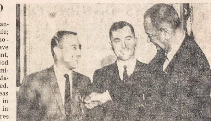
PREZIDENTAS L. B. JOHNSON kovo 25 įteikė astronautam Virgilui Griesom ir John W. Young "nepaprastos tarnybos" medali.

Maskviniai laikraščiai "Pravda" ir "Krasnaja Zvezda" pranešė apie naujai ruošiamą antrojo pasaulinio karo istoriją. Ją numatoma išleisti karo pabaigos 20-sios sukakties proga, š. m. gegužės mėn. pradžioje. Leidinyje neiškeliamos nei Stalino, nei Chruščiovo pavardės bei jų vaidmuo pastarojo karo metu.