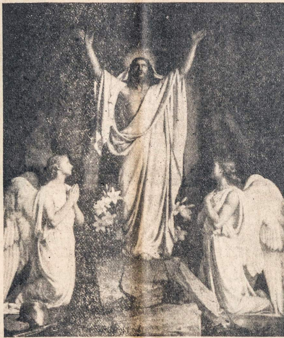
KRISTUS TREČIĄJĄ DIENĄ KĖLESI IŠ KAPO...

Galingame Kristaus iš mirties prisikėlimo įvykyje išpina ir Sv. Tomas Apaštalas savo netikėjimu, kurį tik tada įtikėjo, kada savo Mokytoją ir Jo žaidas pamatė savo akimis. Visa tai stebint, pasirodo, kad apaštalai nebuvo lengvatikiai: jie pirmesniųjų liudijimų apie Kristaus prisikėlimą nepriėmė lengvai — jiems visiems Išganytojas turėjo aiškiai pats pasirodyti! Tačiau vis dėlto Išganytojas Sv. Tomo asmenyje