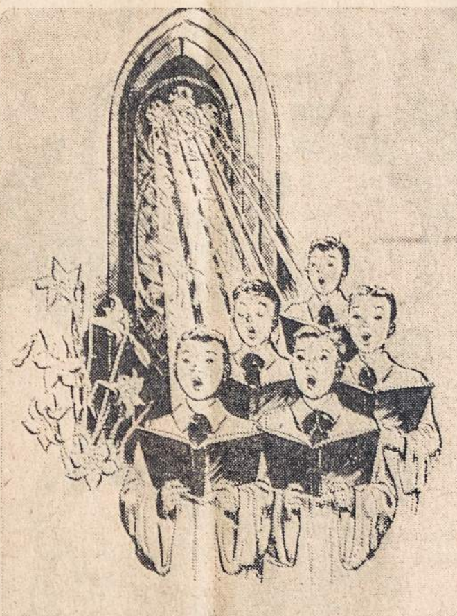
"LINKSMA DIENA MUMS NUŠVITO..."

Iš metinio raporto jūs turėsite pilną ir tikrą finansinių Susivienijimo