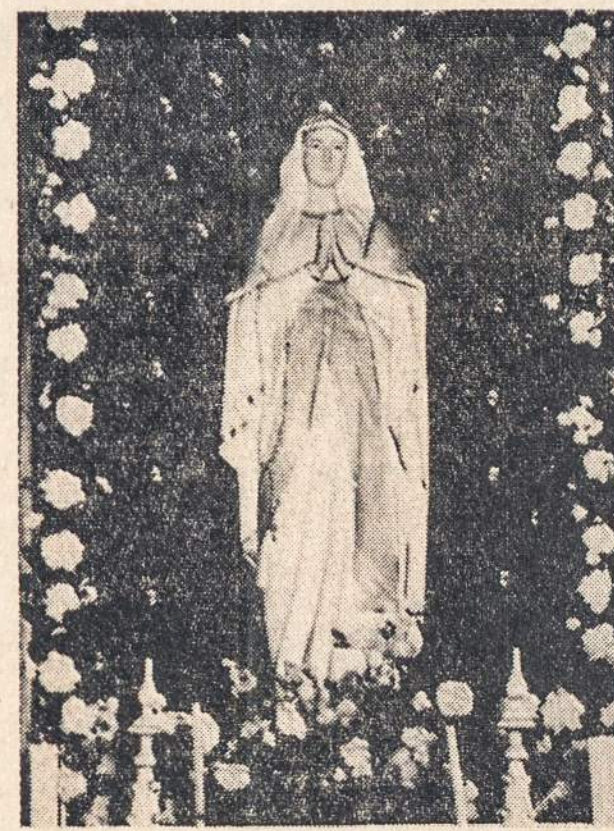
MARIJOS statula Skiemonių bažnyčios didžiajame altoriuje.

MEXICO CITY, MEXICO. — gruodžio 27 buso nelaimėje žuvo 7 asmenys, sužeistų 58. Sugedus veržtuvams (brakes), busas prie užsikimo sustrenkė su penkiais automobiliais.