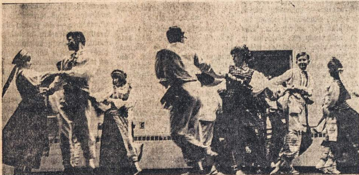
TAUTINIAI šokiai jaunųjų talentų vakare Newarko sausio 9. šokius parengė ir jį vadovavo J. Vaidičaitė.