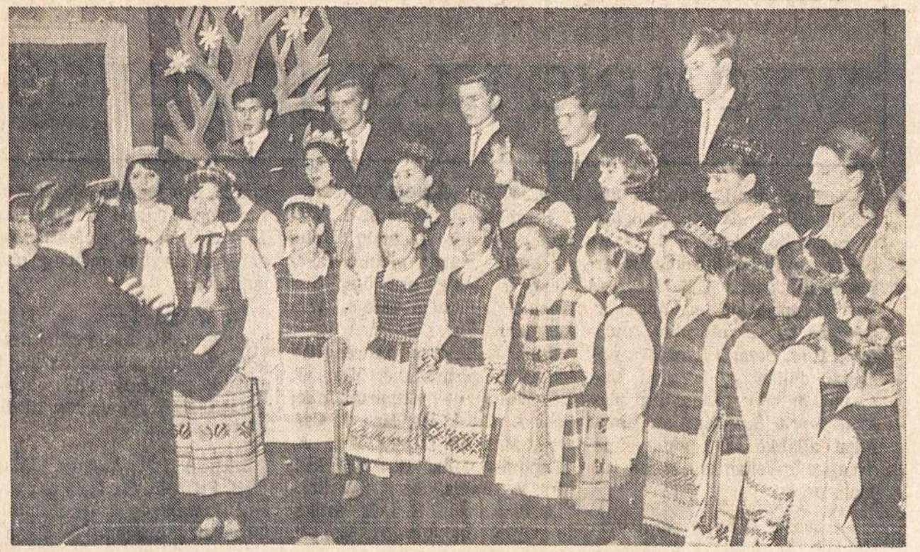
VASARIO 16 GIMNAZIJOS VOKIETIJOJ Kalėdų eglutės programa.

141 kuopos susirinkimai bus: vasario mėn. 7 d., balandžio mė 4 d. birželio 6 d., rugpjūčio 1, spalio 3, ir gruodžio 5 d. po 10 val. pamaldų salėje po bažnyčia.