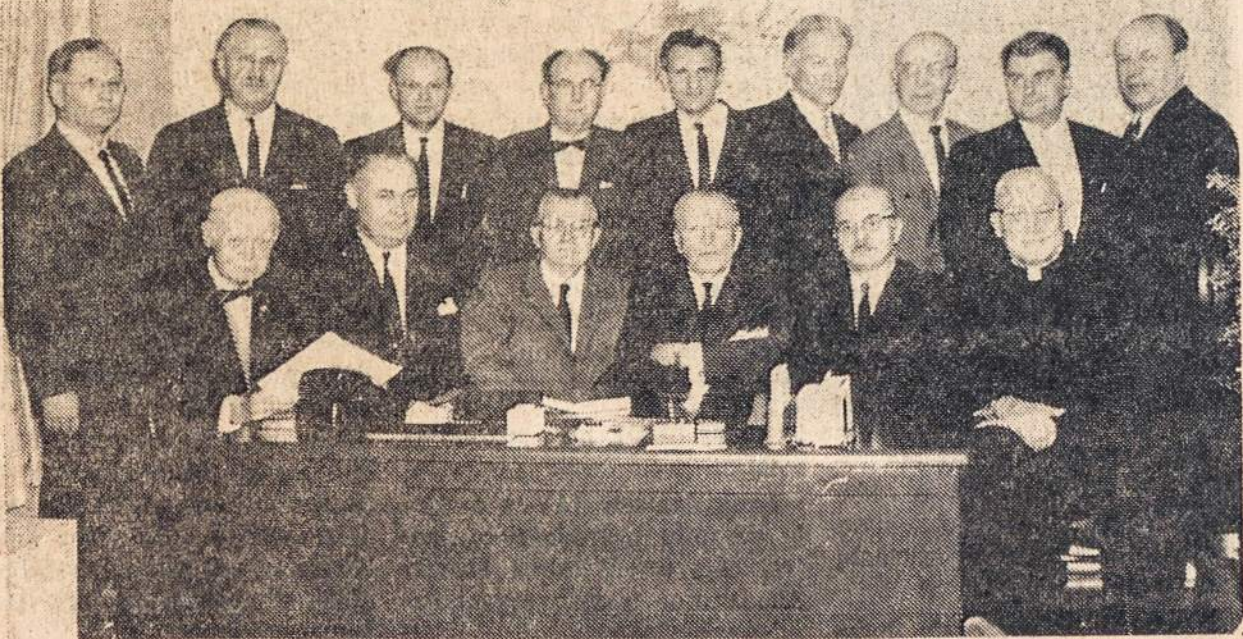
ALTO Vliko posėdžio, įvykusio Chicagoje, dalyviai.