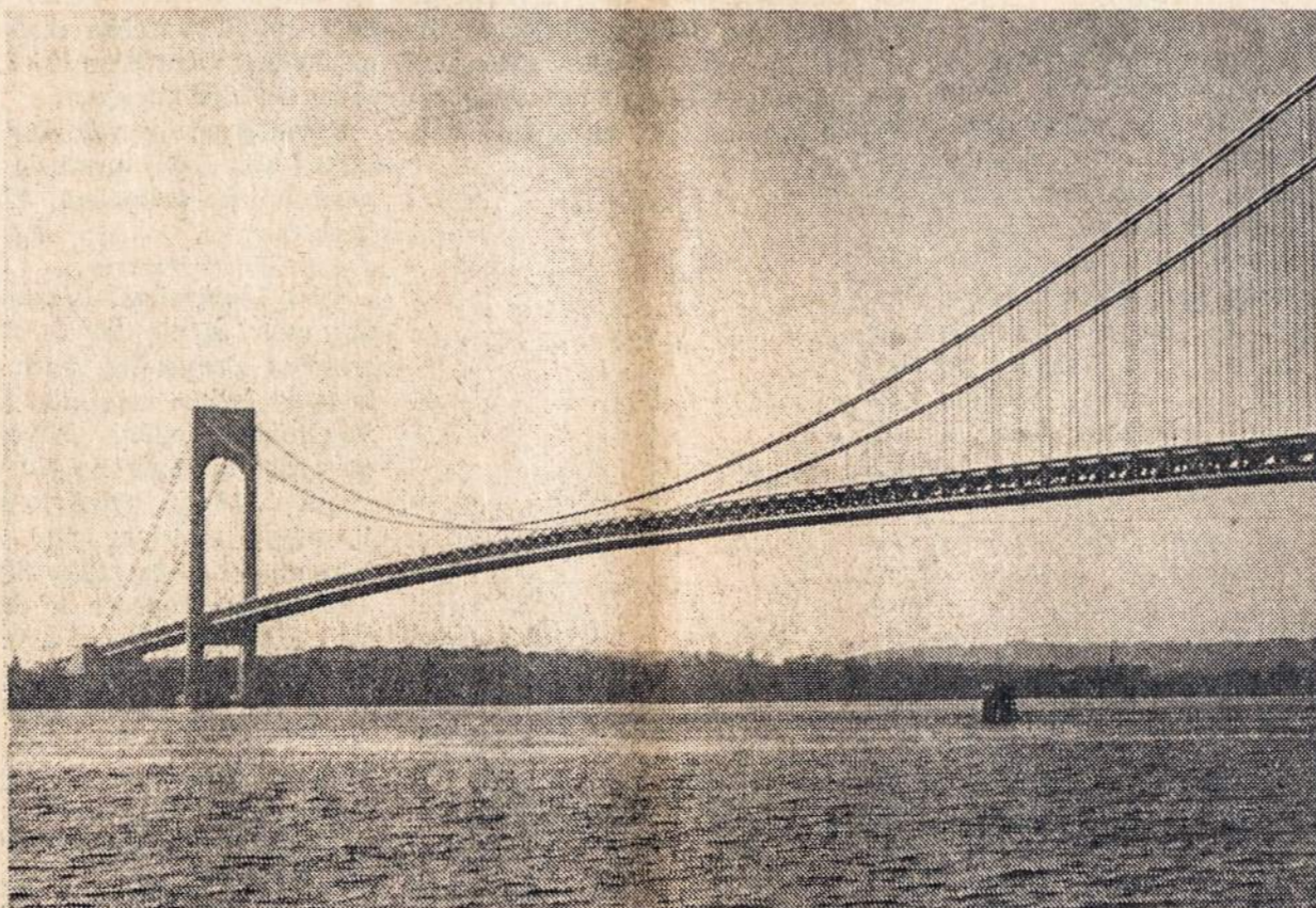
VERRAZANO-NARROWS TILTAS, jungiąs Brooklyną su Staten Island sala. Tiltas atidarytas lapkričio 21 Jo pastatymas atsiėjo 325 milijonų dol.