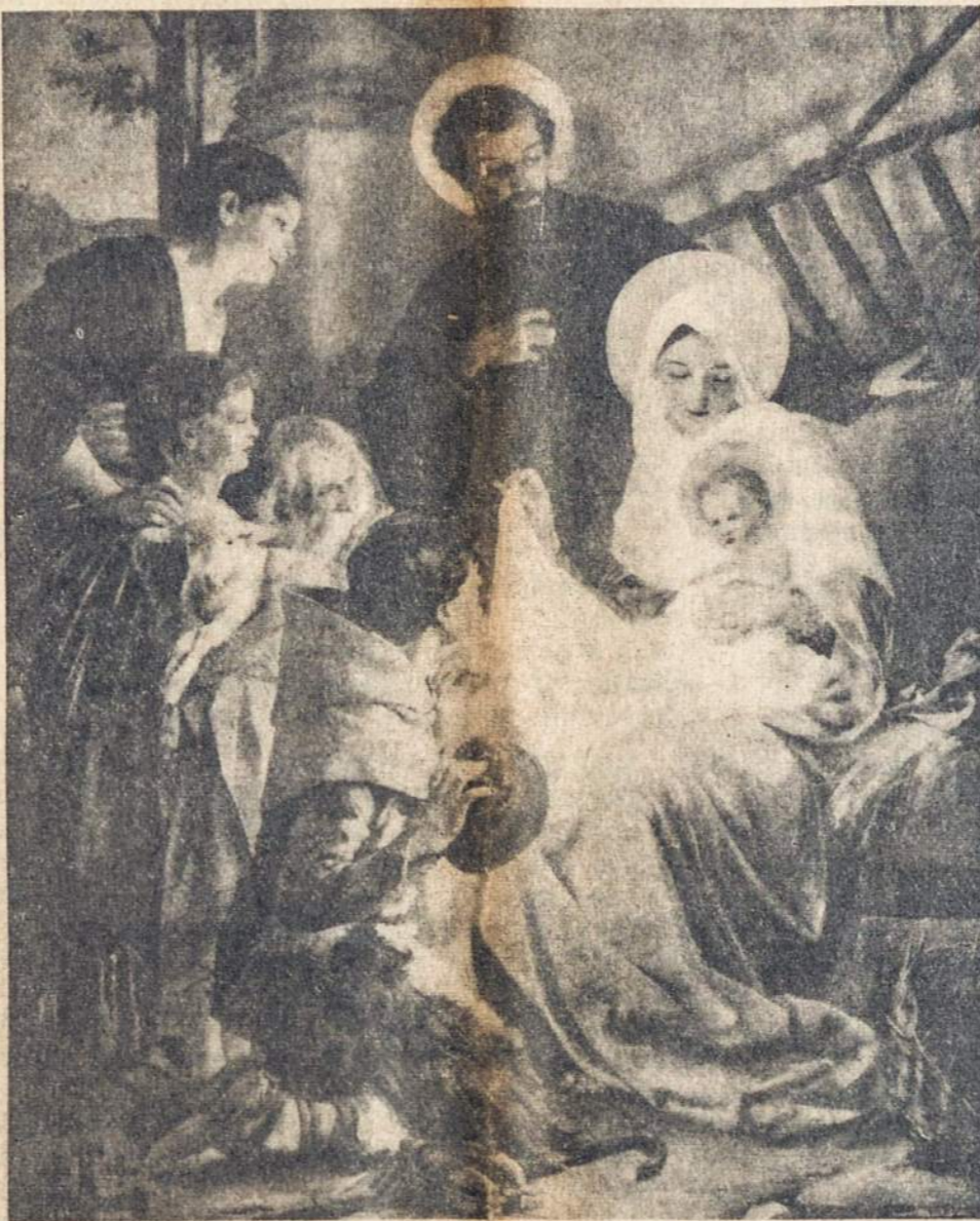
"MES ATBEGOM, PIEMENELIAI, ŠIO PASAULIO VARGDIENELIAI, TAVE, DIEVA, GARBINTI..."

Jeį Kristus panorė, kad mes Jį pažintume kaip nukryžiuotą ir tokį sektumė, privalome dėti visas pastangas pirmiausia savyje naikinti blogąją valią, o paskiau ir kituose, kad tuo būdu mūsų širdyse įsiviešpatautų dieviška ramybė ir taika visame pasaulyje, kurią taip plačiai skelbia, garsiai gausdami Kalėdų ryto varpai!