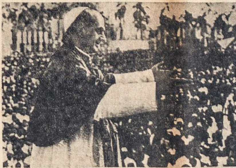
POPIEZIUS PAULIUS BOMBEJUJE.

Proserpina: — Na, driskiai, nuobodu čia be cirko ir arenos, kad triukšmą keltiate? Ką?