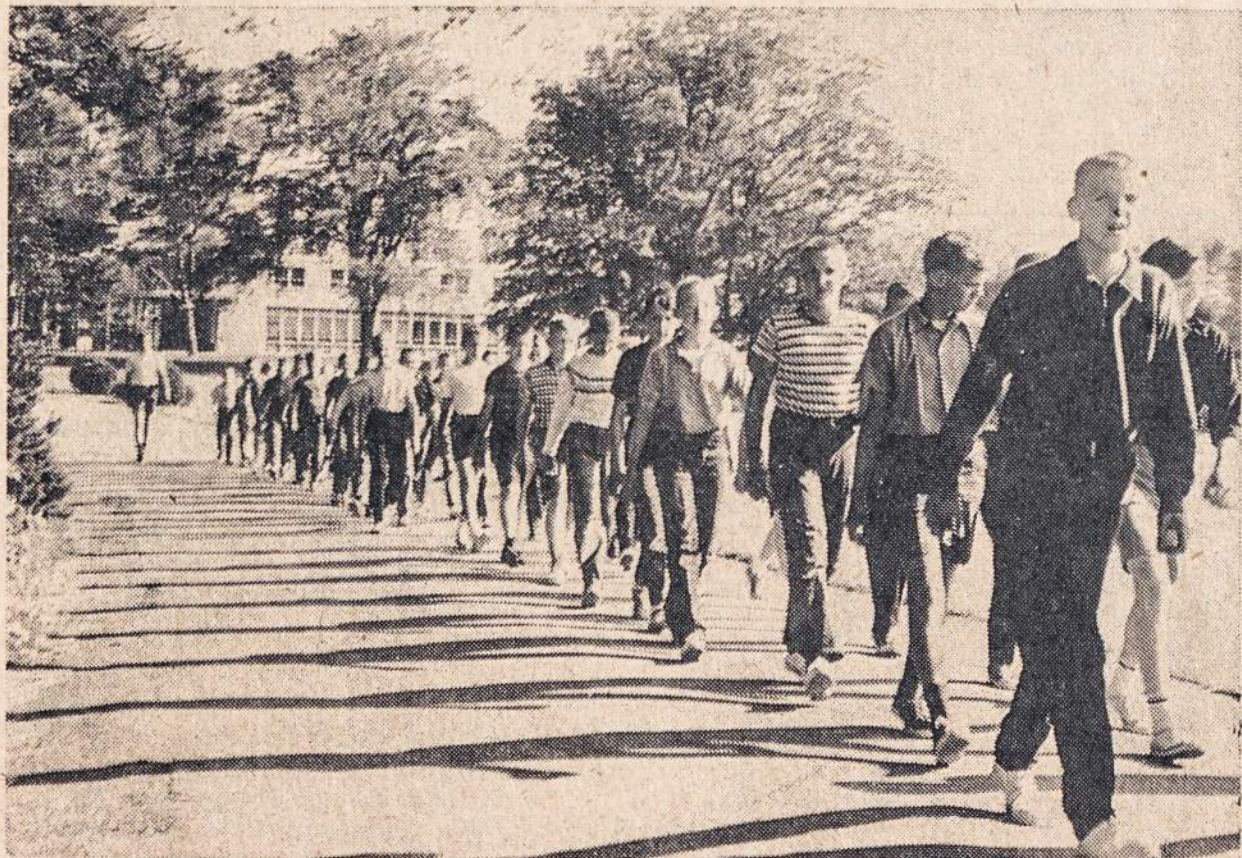
KENNEBUNKPORTE vasaros stovykloje berniukai žygiuoja vėliavą kelti.

P. S. Pareikalavus, siunčiame medžiagų katalogus; norintys katalogus gauti — malonėkite prisijust 10 centų pašto ženklais.