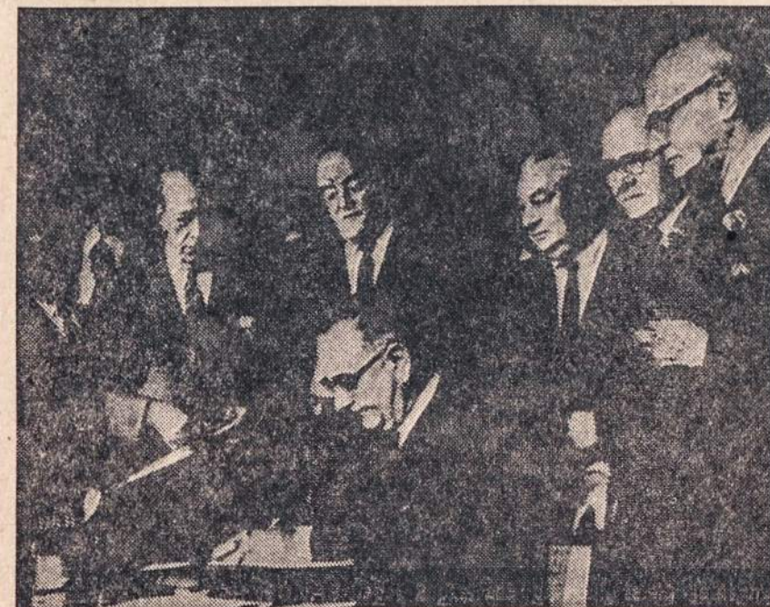
PREZIDENTAS JOHNSONAS liepos 2 pasirašė "pilietinių teisių" įstatymą.