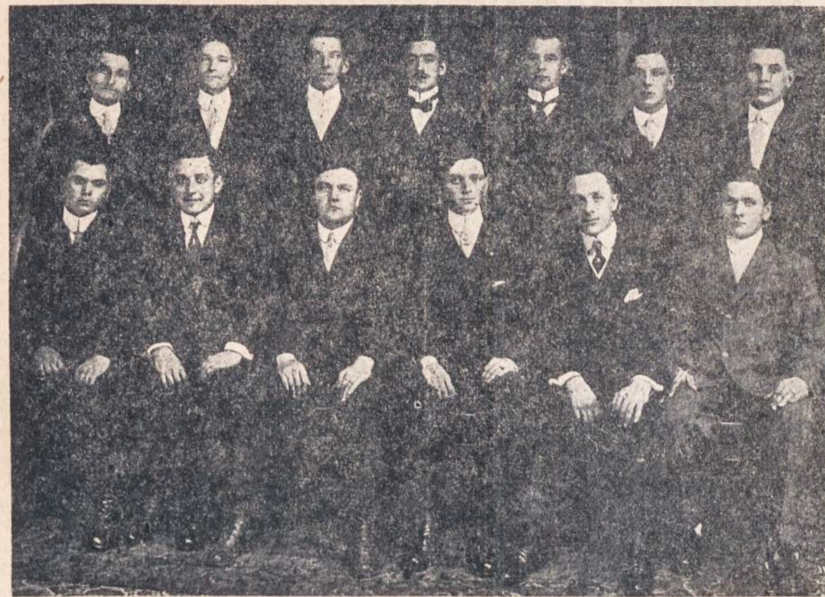
PIRMOSIOS LIETUVIŲ DIENOS RENGIMO KOMITETAS