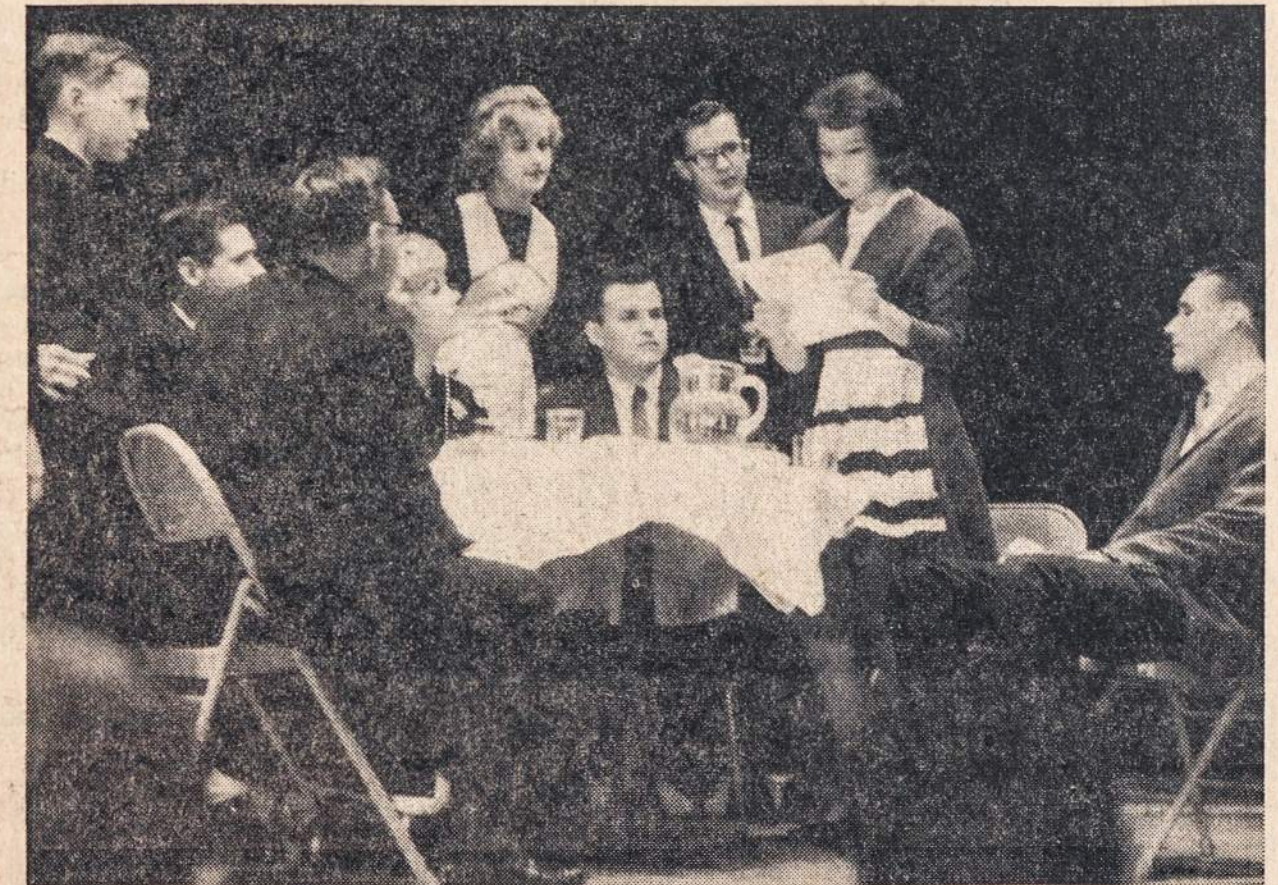
JAUNIEJI VYČIAI savo šventėjeko 3 Apreiškimo parapijos salėje Brooklyne išpildė montażą šv. Kazimiero garbei.

Užsisakant kreipkitės į "GARSO" ADMINISTRACIJĄ P.O. Box 32 (71-73 S. Washington St.), Wilkes-Barre, Pa.