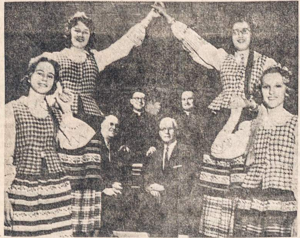
SCRANTON, PA., Sv. Juozapo parapijos mokyklos mokiniai paminėjo Vasario 16 šventę. Už tautinius drabužius apsirengusių mergaičių matosi šventei rengti komitetas.