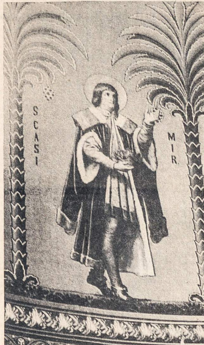
SV. KAZIMIERO paveikslas Bavarijos karalių sosto salėje, Hohenschwan-gau pilyje.

Over Eastern Europe has descended, in the words of Winston Churchill, "a long night of barbarism, unbroken by even a star of hope" unless the American people continue to insist and to maintain that under no circumstances will they bargain away the sacred right of independence of Lithuania and her sister republics.