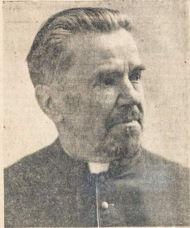
SUKAKTUVININKAS PRELATUS MYKOLAS KRUPAVIČIUS

Šių metų rugsėjo 29-tą Vyriausiojo Lietuvos Išlaisvi-mo Komiteto pirmininkui prelatui Mykolui Krupavičiui sueis 70 metų amžiaus.