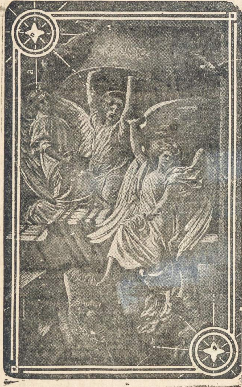
"KELĖS KRISTUS, MIRTIS KRITO, ALELIUJA, ALELIUJA, ALELIUJA!"

Padarykim, kad bent Velykų šventės prašvistų tremtinio niūrus kampelis, kad jis alkio nejaustų, kad vaikučiai bent po vieną kitą margutį turėtų.