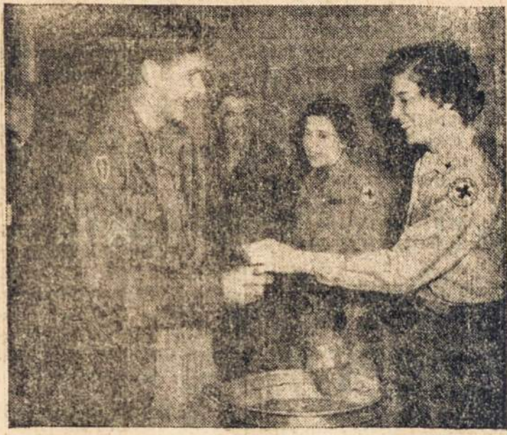
A square-dancing soldier gets a cup of coffee from Red Cross Clubmobile girls who sponsor a party for servicemen at an outpost in Korea. The girls bring entertainment and recreation to our servicemen in that corner of the world. Similar Red Cross programs are in operation in Europe and North Africa.