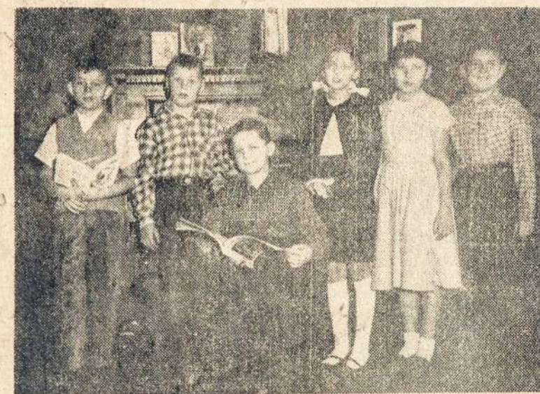
Trečiojo ir ketvirtojo skyrių tretininkai Šv. Jurgio parapijos mokykloje, Rochester, N. Y., skaito lietuviškus žurnalus