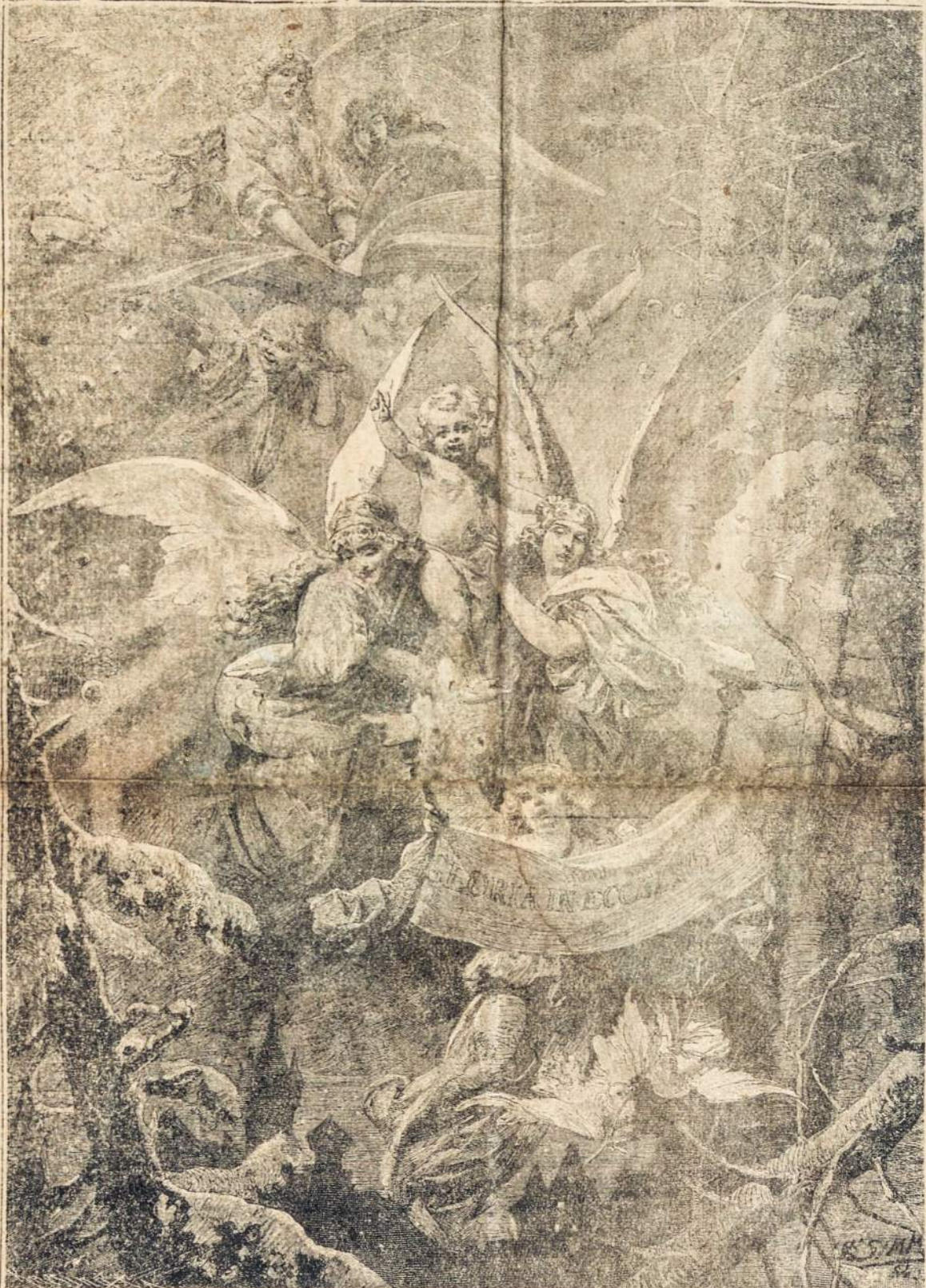
SAVO ŠIRDIS JAM AUKOKIM IR SU ANGELAIS GIEDOKIM: GARBĖ TAU AUGSTYBĖSE!

LRKSA VYKDOMOJI TARYBA "GARSO" REDAKCIJA