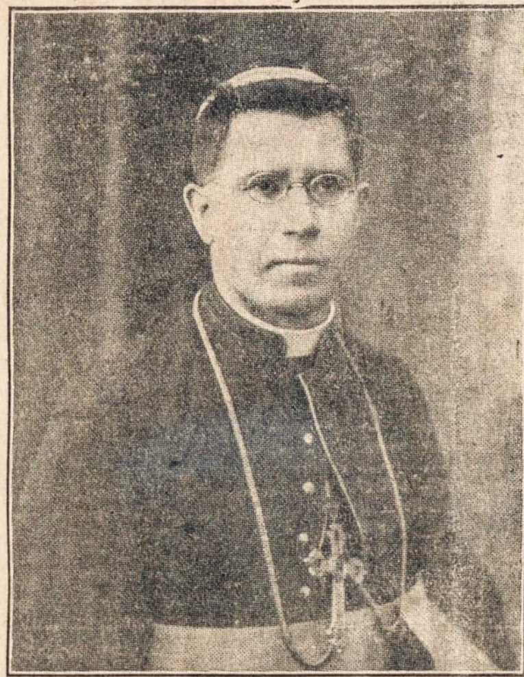
A. A. ARKIVYSKUPAS M. REINYS

Naujai gautos žinios iš Lietuvos praneša, kad Vilniaus arkivyskupas Mečislovas Reinys Vladimiro kalėjime (pranešime sakoma: Vladimir na Klazme) mirė.