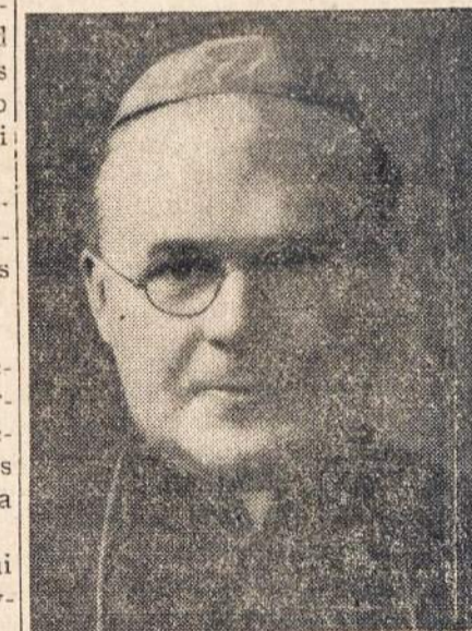
ARKIV. KONSTANTINAS BOGACEVSKIS

PHILADELPHIA, Pa.—Vic- tinis ukrainiečių katalikų vysku- pas-ekzarkas, Konstantinas Bo- gačevskis, už savo labai uolų veiklą taip Dievo garbei, kaip ir žmonių naudai, o ypač gi nauja- kurių, balandžio 5-tą Sv. Tėvo pakeltas arkivyskupu.