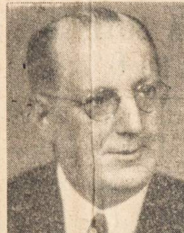
U. S. Kongresmanas Ivor D. Fenton

Ypač stiprią paramą šiai rezoliucijai teikia Kongreso nariai Carrigg iš Lackawanna apskrities, Bonin iš Luzerne apskrities, dr. Fenton iš Schuylkill apskrities, Busbey iš Chicago, Roman Lee Hruska iš Omaha, Neb. Prie jų prisidėjo įtakingas Kongreso narys Hugh Scott, Taisyklių komiteto narys. Jis pasižadėjo komitetui pasiūlyti tuojau įtraukti Kersteno rezoliuciją į Kongreso darbotvarkę, kad ji