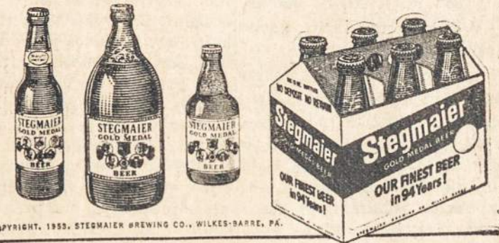
COPYRIGHT, 1953, STEGMAIER BREWING CO., WILKES-BARRE, PA.

IT'S COOL BLENDED FOR CLEAN TASTE CLEAR THROUGH