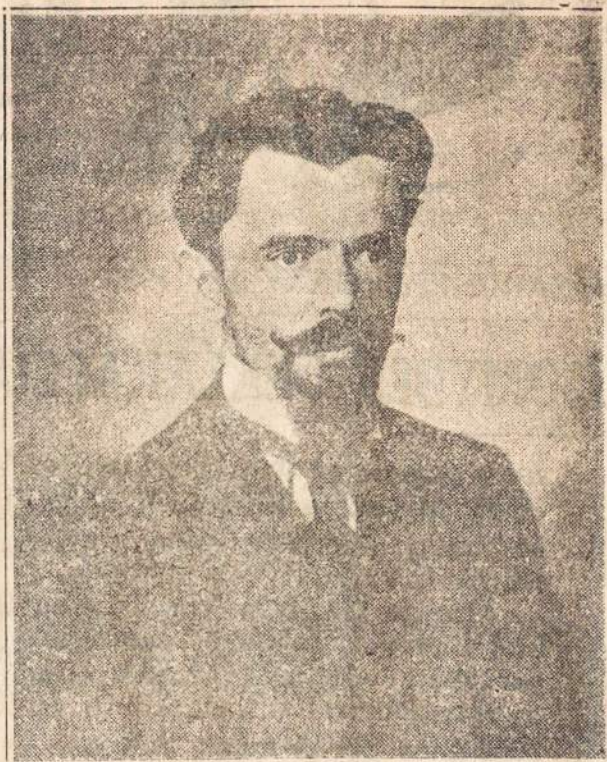
PRELATUS MYKOLAS KRUPAVIČIUS

Jo kalbos metu karo laimė galiausiai perisikverbė Unijos naudai; buvo paskelbtas vergijos panaikinimas, vergų išliuosavimas. Lincoln'as buvo pačioje savo didybėje—politiškai, intelektualiai, kai ir morališkai. Bet jis niekaados neatsisakė nuo tautos, kurią jis taip mylėjo ir pasitikėjo. Gal tai yra priežastis, kodėl ir amerikiečiai, prisimindami Lincoln'ą atsiliepia apie jį šilčiau, negu apie kokį kitą jų didvyrį. C. C.