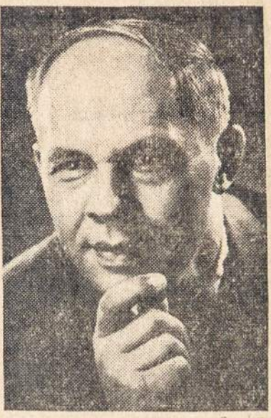
PROF. JUOZAS BRAZAITIS, buvęs Lietuvos vyriausybės ministras pirmininkas, kalbėtojas Scrantono Lietuvių Dienoje.